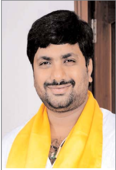
(షణ్ముఖ వెలుగు, కొండపి ఇంచాద్రి, సెప్టెంబర్ 20)