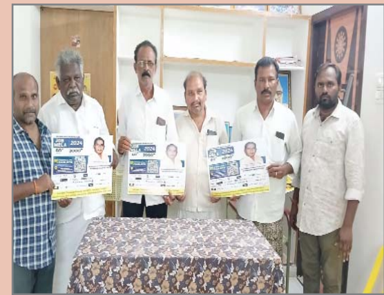
(షణ్ముఖ వెలుగు, పాపిలూరు, సెప్టెంబర్ 20)