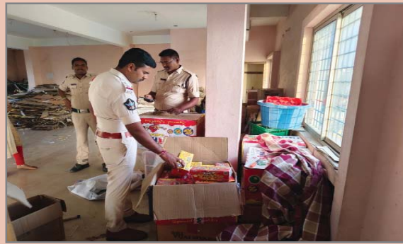
(షణ్ముఖ వెలుగు, కంభం, సెప్టెంబర్ 20)