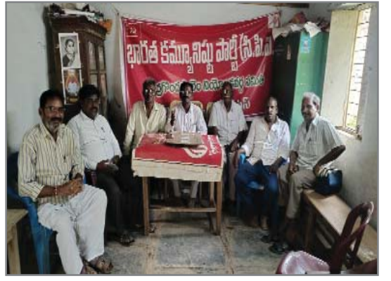
(షణ్ముఖ వెలుగు, యర్రగొండపాలెం ఇన్సూర్టి, సెప్టెంబర్ 20)