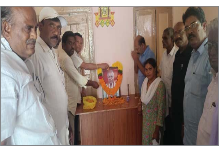
(షణ్ముఖ వెలుగు, కనిగిరి టౌన్, సెప్టెంబర్ 20)

ఘనంగా ఇరిగినేని తిరుపత నాయుడు జయంతిని పురస్కరించుకుని దివ్యాంగుల హక్కుల వేదిక రాష్ట్ర కార్యాలయంలో ఇరిగినేని తిరుపతి నాయుడు చిత్రపటానికి రాష్ట్ర అధ్యక్షులు నివాళులర్పించారు.