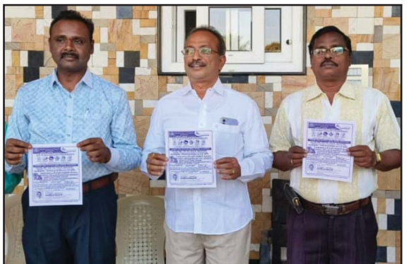
(షణ్ముఖ వెలుగు, ఆదోని, సెప్టెంబర్ 20)