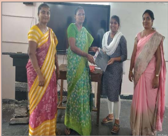
(షణ్ముఖ వెలుగు, ఒంగోలు, సెప్టెంబర్ 20)

జాతీయ కోడింగ్ వారోత్సవాన్ని పురస్కరించుకుని దామచర్ల నకుబ్రాయమ్మ ప్రభుత్వ మహిళా డిగ్రీ కళాశాల, ఒంగోలులో వరుసగా రెండవ రోజు అనగా సెప్టెంబర్ 20న మధ్యాహ్నం 3 గంటలకు బగ్ ఫిక్సింగ్, అవుట్పుట్ ట్రేనింగ్ కోడింగ్ టెస్ట్ నిర్వహించబడింది.