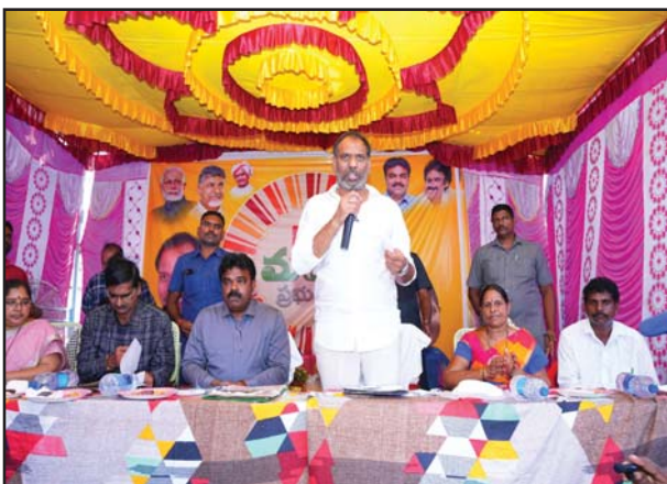
(షణ్ముఖ వెలుగు, సంతమాగులూరు, సెప్టెంబర్ 20)