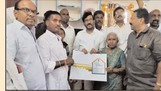
(షణ్ముఖ వెలుగు, నెల్లూరు, సెప్టెంబర్ 17)