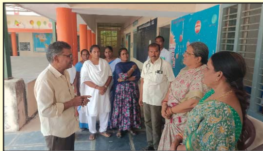
(షణ్ముఖ వెలుగు, ఉలవపాడు, సెప్టెంబర్ 17)