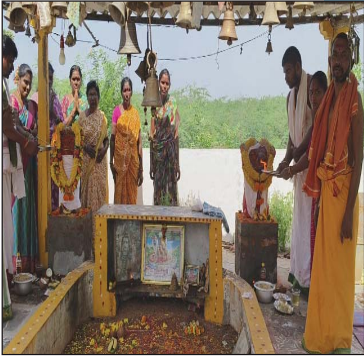
(షణ్ముఖ వెలుగు, సింగరాయకొండ, సెప్టెంబర్ 17)

శ్రీ నాగేంద్ర స్వామికి మొక్కులు వొక్కి ఆ తర్వాత ఆ భక్తుల కోర్కెలు రోజుల వ్యవధిలోనే తీర్చి వారి సాధక బాధలు వారు కోరిన కోర్కెలు తీర్చేటటువంటి శ్రీ నాగేంద్ర స్వామి అమ్మవారి కరుణ కటాక్షాలు భక్తులకు కొంగు బంగారం లాగా నాగేంద్ర స్వామికి వారి వారి కోర్కెలు తీరిన తర్వాత ఆ ప్రదేశానికి వచ్చి వారు ఘనంగా కుటుంబ సభి సమీపంగా స్వామివారి సన్నిధానంలో పూజా కార్యక్రమాలు ఘనంగా పురోహితుడు సమక్షంలో స్వామివారికి ధూప దీప నైవేద్యం తోపాటు పూల అలంకరణ పనులు కుంకుమలతో ఆ ప్రాంతమంతా అనగా నాగేంద్ర స్వామి ప్రాంగణంలో కోలాహలముగా విల్లా పాపను పెద్దలతో శ్రీ పురుషుడు తేడా లేకుండా ప్రతి ఒక్కరూ నాగేంద్ర స్వామి దగ్గరికి వచ్చి ఎవరికి తోచినంత వారు పూజా కార్యక్రమాలు విజయవంతంగా నిర్వహిస్తుండడం తీర ప్రాంత గ్రామాల ప్రజలతో పాటు రాష్ట్ర వ్యాప్తంగా నాగేంద్ర స్వామి ప్రాంగణం కులమతాలకు అతీతంగా ప్రతి ఒక్కరూ ఈ ప్రదేశానికి వచ్చి వారు తమ తమ మొక్కులు తీర్చుకుంటారు. ఇది జగమెరిగిన సత్యం. అంతవరకు బాగానే ఉంది ప్రకాశం జిల్లా సింగరాయకొండ మండలం శాసనసభా గ్రామపంచాయతీ పరిధిలో ఉన్న ద్వారకా నగర్ కాలనీలో రోడ్డు ప్రక్కన వెలసి ఉన్న నాగేంద్ర స్వామి ప్రాంగణం ప్రతిరోజూ స్వామివారికి భక్తులు విజయవంతంగా పూజా కార్యక్రమాలు నిర్వహిస్తుండడం ఆ ప్రాంత ప్రజలు ప్రత్యేకంగా హర్షం వ్యక్తం చేస్తున్నారు. ఇటీవల ద్వారకా నగర్ ప్రయాణిస్తున్న కుటుంబ సభ్యులు మార్గమధ్యంలో స్వామివారి సన్నిధానం ప్రక్కన తమ కారుని ఆపుకొని వారు పిల్లాపాపలతో కుటుంబ