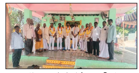
(షణ్ముఖ వెలుగు, మర్రిపూడి, సెప్టెంబర్ 17)