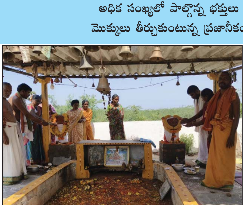
అధిక సంఖ్యలో పాల్గొన్న భక్తులు మొక్కులు తీర్చుకుంటున్న ప్రజానీకం

శ్రీ నాగేంద్ర స్వామికి మొక్కులు వొక్కి ఆ తర్వాత ఆ భక్తుల కోర్కెలు రోజుల వ్యవధిలోనే తీర్చి వారి సాధక బాధలు వారు కోరిన కోర్కెలు తీర్చేటటువంటి శ్రీ నాగేంద్ర స్వామి అమ్మవారి కరుణ కటాక్షాలు భక్తులకు కొంగు బంగారం లాగా నాగేంద్ర స్వామికి వారి వారి కోర్కెలు తీరిన తర్వాత ఆ ప్రదేశానికి వచ్చి వారు ఘనంగా కుటుంబ సభి సమీపంగా స్వామివారి సన్నిధానంలో పూజా కార్యక్రమాలు ఘనంగా పురోహితుడు సమక్షంలో స్వామివారికి ధూప దీప నైవేద్యం తోపాటు పూల అలంకరణ పనులు కుంకుమలతో ఆ ప్రాంతమంతా అనగా నాగేంద్ర స్వామి ప్రాంగణంలో కోలాహలముగా విల్లా పాపను పెద్దలతో శ్రీ పురుషుడు తేడా లేకుండా ప్రతి ఒక్కరూ నాగేంద్ర స్వామి దగ్గరికి వచ్చి ఎవరికి తోచినంత వారు పూజా కార్యక్రమాలు విజయవంతంగా నిర్వహిస్తుండడం తీర ప్రాంత గ్రామాల ప్రజలతో పాటు రాష్ట్ర వ్యాప్తంగా నాగేంద్ర స్వామి ప్రాంగణం కులమతాలకు అతీతంగా ప్రతి ఒక్కరూ ఈ ప్రదేశానికి వచ్చి వారు తమ తమ మొక్కులు తీర్చుకుంటారు. ఇది జగమెరిగిన సత్యం. అంతవరకు బాగానే ఉంది ప్రకాశం జిల్లా సింగరాయకొండ మండలం శాసనసభా గ్రామపంచాయతీ పరిధిలో ఉన్న ద్వారకా నగర్ కాలనీలో రోడ్డు ప్రక్కన వెలసి ఉన్న నాగేంద్ర స్వామి ప్రాంగణం ప్రతిరోజూ స్వామివారికి భక్తులు విజయవంతంగా పూజా కార్యక్రమాలు నిర్వహిస్తుండడం ఆ ప్రాంత ప్రజలు ప్రత్యేకంగా హర్షం వ్యక్తం చేస్తున్నారు. ఇటీవల ద్వారకా నగర్ ప్రయాణిస్తున్న కుటుంబ సభ్యులు మార్గమధ్యంలో స్వామివారి సన్నిధానం ప్రక్కన తమ కారుని ఆపుకొని వారు పిల్లాపాపలతో కుటుంబ