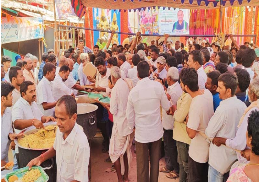
(షణ్ముఖ వెలుగు, యర్రగోండపాలెం ఇన్‌ఛార్జి, సెప్టెంబర్ 16) యర్రగోండపాలెం కొలుకుల సెంటర్ లో వేంచేసియున్న వరసిద్ది వినాయక స్వామీ కళ్యాణ మహోత్సవం సందర్భంగా పట్టణంలో అన్నాదాన కార్యక్రమం జరిగింది. వరసిద్దివినాయక స్వామీ కళ్యాణ మహోత్సవం సందర్భాన్ని పురస్కరించుకొని యర్రగోండపాలెం ఎమ్మెల్యే తాటిపర్తి