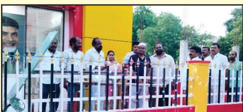
(షణ్ముఖ వెలుగు, కనిగిరి లోన్, సెప్టెంబర్ 16)