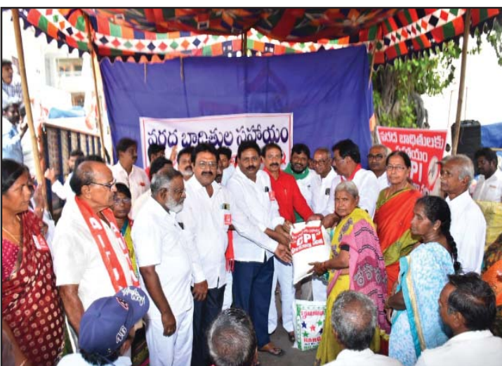
(షణ్ముఖ వెలుగు, విజయవాడ, సెప్టెంబర్ 13)

రూ.5 లక్షల విలువైన సామాగ్రి విజయవాడలో పంపిణీ