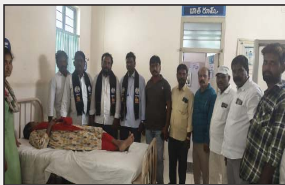
(షణ్ముఖ వెలుగు, వెలిగండ్ల, సెప్టెంబర్ 13)