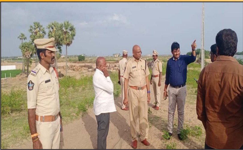
(షణ్ముఖ వెలుగు, బాపట్ల, సెప్టెంబర్ 13)

బాపట్ల జిల్లా ఎస్పీ తుషార్ దూడి ఆదేశాల మేరకు ఇసుక అక్రమ తవ్వకాలు జరిగిన ప్రదేశాలను అడిషనల్ ఎస్పీ టి.పి.విరతేశ్వర్ పరామర్శించారు. ఇసుక అక్రమ తవ్వకాలు, రవాణా జరగకుండా పటిష్ట చర్యలు తీసుకున్నామన్నారు. అక్రమ తవ్వకాలు, రవాణాకు పాల్పడితే కఠిన చర్యలు తీసుకుంటామని జిల్లా ఎస్పీ తుషార్ దూడి తెలిపారు. ఇసుక అక్రమ తవ్వకాలు, రవాణాకు పాల్పడితే కఠిన చర్యలు తీసుకుంటామని జిల్లా ఎస్పీ హెచ్చరించారు. ఎస్పీ ఆదేశాల మేరకు అడిషనల్ ఎస్పీ టి.పి.విరతేశ్వర్ శుక్రవారం చీరాల మండలంలోని విజయ లక్ష్మి పురం గ్రామ పరిధిలో ఇసుక అక్రమ తవ్వకాలు జరిగిన ప్రదేశాలను పరిశీలించారు. ఇసుక అక్రమ తవ్వకాలను అడ్డుకోవడానికి తీసుకోవాల్సిన చర్యల గురించి పోలీస్, రెవెన్యూ ఇతర శాఖల అధికారులకు పలు సూచనలు చేశారు. ఎస్పీ ఆదేశాలతో