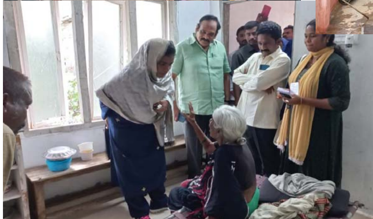
(షణ్ముఖ వెలుగు స్టాఫ్ రిపోర్టర్, ఒంగోలు, ఆగస్టు 1)