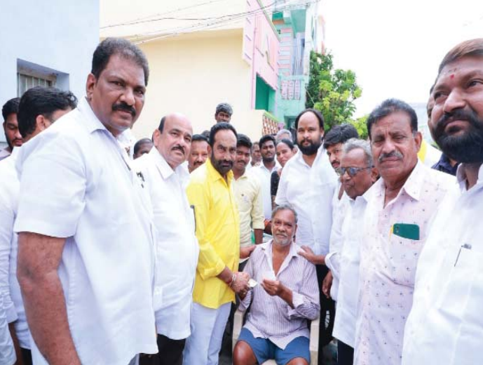
(షణ్ముఖ వెలుగు, మాచర్ల టౌన్, ఆగస్టు 1)