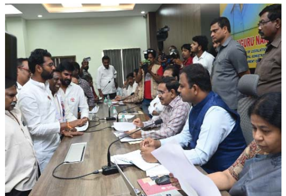
(షణ్ముఖ వెలుగు, నెల్లూరు, ఆగస్టు 1)