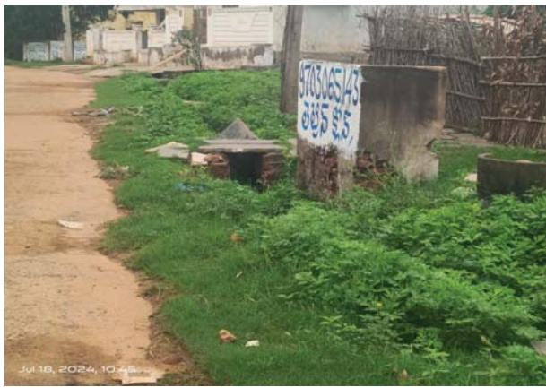
(షణ్ముఖ వెలుగు, సింగరాయకొండ, ఆగస్టు 1)

మండలంలోని పాత సింగరాయకొండ గ్రామ పంచాయతీ పరిధిలో డ్రైనేజీ సమస్య ఆ గ్రామ పంచాయతీ ప్రజలకు శాపంగా మారింది అని చెప్పడంలో ఎలాంటి సందేహం అక్కర్లేదని గ్రామపంచాయతీ ప్రజలు ఆవేదన వ్యక్తం చేస్తున్నారు అయితే ఈ నేపథ్యంలో భాగంగా గ్రామపంచాయతీ పరిధిలో ఉన్న శ్రీశ్రీశ్రీ వరాహ లక్ష్మీనరసింహస్వామి దేవస్థానం ఇక్కడ కలిసి ఉంది ఈ ఆలయానికి అంతో విశేషమైన చరిత్ర ఉంది. అయితే ఇలాంటి గొప్ప పంచాయతీలో ప్రజానీకం సాయంత్రం 6 దాటితే డ్రైనేజీ కాలువలో ఉన్న దోమలు ప్రజలను పీల్చి పిప్పి చేస్తున్నాయని పంచాయతీలో ఉన్న మహిళలు ఆవేదన వ్యక్తం చేస్తున్నారు.