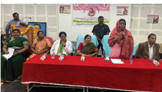
(షణ్ముఖ వెలుగు, ఒంగోలు, ఆగస్టు 1)