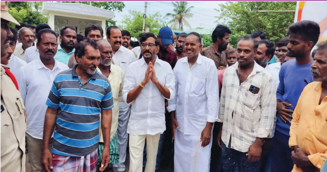
(షణ్ముఖ వెలుగు, సర్వేపల్లి, ఆగస్టు 1)

తోటపల్లి గూడూరు మండలంలోని చింతోపు, కొత్తపాళెం, తోటపల్లి, ఇన్నపాళెం, చుట్టికార్డున వురంలో పింఛన్లను సర్వేపల్లి ఎమ్మెల్యే సోమిరెడ్డి చంద్రమోహన్ రెడ్డి పంపిణీ చేశారు. ఒకటి తేదీన ఉదయం నుంచి పింఛన్ పంపిణీ చేయడంపై లబ్ధిదారుల్లో ఆనందం నెలకొంది. టీడీపీ కూటమి అధికారంలోకి వచ్చిన తర్వాత నారా చంద్రబాబు నాయుడు నాయకత్వంలో పింఛన్లను రూ.4 వేలు నుంచి రూ.15 వేలు వరకు అందజేయడం అద్భుతమని సోమిరెడ్డి తెలిపారు. దేశంలో రూ.30తో సామాజిక పింఛన్ పథకానికి శ్రీకారం చుట్టిన మహానుభావుడు ఎన్టీఆర్ అని చంద్రమోహన్ రెడ్డి పేర్కొన్నారు. రూ.2 వేలు పింఛన్లను రూ.3 వేలకు పెంచడానికి జగన్మోహన్ రెడ్డికి నాలుగేళ్లు పట్టినది విమర్శించారు. చంద్రబాబు నాయుడు ఇచ్చిన మాట ప్రకారం ఒక్కసారిగా రూ.4 వేలకు పెంచి లబ్ధిదారులు ప్రశాంతంగా జీవించే అవకాశం కల్పించారని కితాబు ఇచ్చారు. దేశంలోనే ఈ స్థాయిలో పింఛన్లు