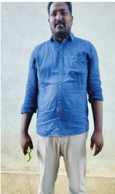
(షణ్ముఖ వెలుగు, ఉలపపాడు, ఆగస్టు 1)