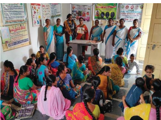
(షణ్ముఖ వెలుగు, మాచర్ల టౌన్, ఆగస్టు 1)