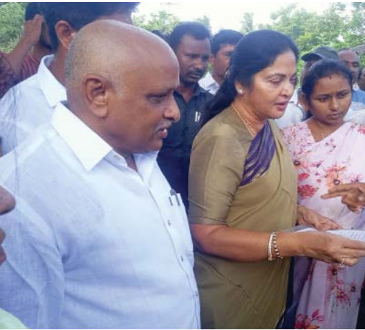
(షణ్ముఖ వెలుగు, నెల్లూరు, ఆగస్టు 1)

ఉదయం 6 గంటలకే ప్రారంభమైన పింఛన్లు పంపిణీ లబ్ధిదారుల ఇళ్లకే వెళ్లి పింఛన్ను అందించిన ఎమ్మెల్యే