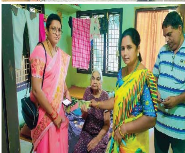
(షణ్ముఖ వెలుగు, ఒంగోలు, ఆగస్టు 1)