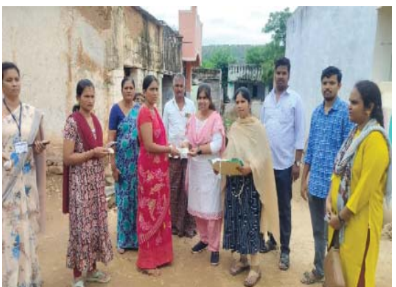
(షణ్ముఖ వెలుగు, మార్కాపురం ఇన్ఛార్జి, ఆగస్టు 1)

పంపిణీ కార్యక్రమంలో పాల్గొన్న ఎంపీడీవో తోట చందన