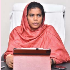
(షణ్ముఖ వెలుగు, ఒంగోలు, ఆగస్టు 1)

ప్రభుత్వ సహాయంతో ప్రారంభమైన గృహ నిర్మాణాలు త్వరగా పూర్తయ్యేలా చూడాలని జిల్లా కలెక్టర్ ఏ తమిళ అన్యాయ అధికారులకు సూచించారు. గృహ నిర్మాణ సంస్థ, టిడో ఆధ్వర్యంలో చేపట్టిన ఇళ్ల నిర్మాణ స్థితిగతులపై