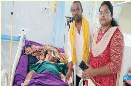
(షణ్ముఖ వెలుగు, ఒంగోలు, ఆగస్టు 1)