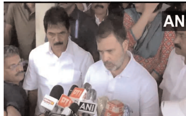
కాంగ్రెస్ కుటుంబం ఇక్కడ 100కుపైగా ఇండ్లను బాధితులకు నిర్మించి ఇస్తుందని, ఇది బాధితులకు తాము ఇస్తున్న భరోసా

వయనాద్: జిల్లాలో కొండచరియలు విరిగిపడిన ఉదంతంలో ఇప్పటివరకూ 300 మందికి పైగా మరణించారు. వయనాద్ ఘటన వ్యూహం విచారకమని లోక్ సభ విపక్ష నేత, కాంగ్రెస్ ఎంపీ రాహుల్ గాంధీ అన్నారు. తాను నిన్నటి నుంచి వయనాద్లోనే ఉన్నానని, ఇది భయానక విషాద ఘటన అని తాము ఇక్కడ అధికారులతో సమావేశమై పరిస్థితి సమీక్షిస్తున్నామని చెప్పారు. ఈ ఘటనలో మృతుల సంఖ్య ఎంతకు చేరవచ్చు, దెబ్బతిన్న గృహాల వివరాలు, నష్టాన్ని తగ్గించేందుకు, సహాయ వున్నారానా కార్యక్రమాలను వేగవంతం చేయడంపై తమ వ్యూహాన్ని అధికారులు తమకు వివరించారని రాహుల్ తెలిపారు. తాము ఎలాంటి సాయం చేసేందుకైనా వెనుకాడమని, ఇక్కడే ఉండి సహాయ కార్యక్రమాలను పర్యవేక్షిస్తామని వివరించామని చెప్పారు.