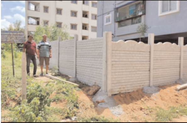
సింహపురి కాలనీ ఏ- బ్లాక్ లో ఆక్రమ ప్రహారీ గోడ నేలమట్టం..