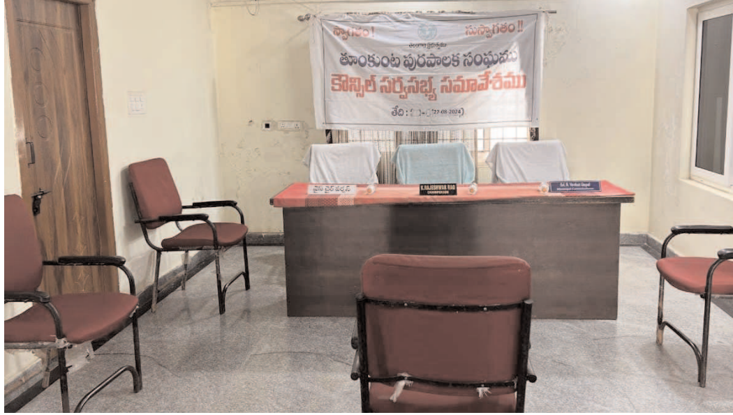
మీడియాకు వివరిస్తూ జనరల్ బాడీ సమావేశం సమంజసమని కౌన్సిలర్ లు ఆగ్రహం వ్యక్తంచేశారు. నిర్వహించక ముందే చైర్మన్ సభ్యులతో తన ఆఫీసు రూం మున్సిపల్ లో ఇలా చైర్మన్ ఎన్సీ అవినీతి అక్రమాలకు లో సంతకాలు ఎలా చేయమని ఇది ఎంతవరకు పాల్పడుతున్నట్లు ఆరోపిస్తున్నారు.