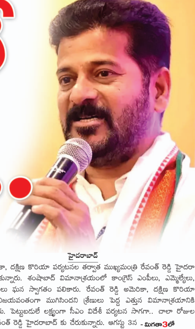
హైదరాబాద్ అమెరికా, దక్షిణ కొరియా పర్యటనల తర్వాత ముఖ్యమంత్రి రేవంత్ రెడ్డి హైదరాబాద్ చేరుకున్నారు. శంషాబాద్ విమానాశ్రయంలో కాంగ్రెస్ ఎంపీలు, ఎమ్మెల్యేలు, పార్టీ శ్రేణులు ఘన స్వాగతం పలికారు. రేవంత్ రెడ్డి అమెరికా, దక్షిణ కొరియా పర్యటన విజయవంతంగా ముగిసినందుకు శ్రేణులు పెద్ద ఎత్తున విమానాశ్రయానికి చేరుకున్నారు. పెట్టుబడులతో లక్ష్యంగా సీఎం రేవంత్ పర్యటన సాగగా.. చాలా రోజుల తర్వాత రేవంత్ రెడ్డి హైదరాబాద్ కు చేరుకున్నారు. ఆగస్టు 3న - మగతా3లో