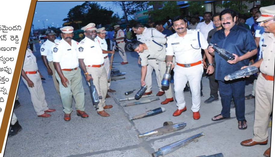
(షణ్ముఖ వెలుగు స్టాఫ్ రిపోర్టర్, ఒంగోలు, ఆగస్టు 27)

(షణ్ముఖ వెలుగు, అమరావతి, ఆగస్టు 27) జగన్ మోహన్ రెడ్డి పాలనలో విద్యుత్ వ్యవస్థ సర్వసాధనమైందని విద్యుత్ శాఖ మంత్రి గొట్టిపాటి రవి కుమార్ అన్నారు. జగన్ రెడ్డి అనారోగ్య నిర్ణయాల కారణంగా డిస్కంల పనితీరు దారుణంగా పడిపోయిందని తెలిపారు. గడిచిన ఐదేళ్లలో కాలంలో డిస్కంల అప్పులు అంతకంతకు పెరిగాయని ఆరోపించారు. డిస్కంల అప్పులు పేరు చెప్పి కరెంటు బిల్లులు పెంచి జగన్ రెడ్డి ప్రజల రక్తం తాగారని మండిపడ్డారు. నాడు చంద్రబాబు అధికారంలో ఉన్నప్పుడు ఐదేళ్లలో ఒక్కసారి కూడా కరెంట్ బిల్లులను పెంచినట్లు లేదన్నారు. అయితే జగన్ రెడ్డి మాత్రం ఐదేళ్ల కాలంలో 9 సార్లు విద్యుత్ చార్జీలను పెంచారని దుయ్యబట్టారు. డిస్కంల పేరు చెప్పి జగన్ విద్యుత్ చార్జీలు పెంచినా.. డిస్కంలకు ఒంగింది ఏమీ లేదని మంత్రి గొట్టిపాటి రవి కుమార్ అన్నారు. అంతేగాక వైసీపీ (తరువాయి 4లో...)