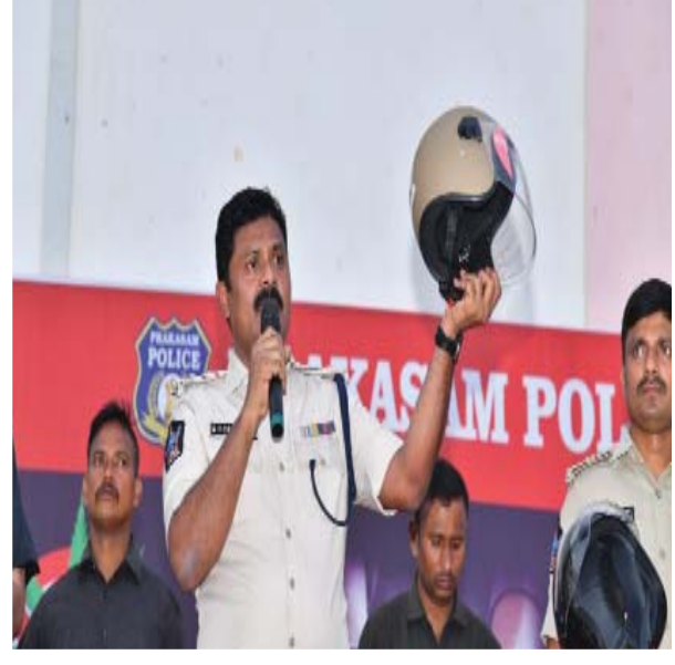
(షణ్ముఖ వెలుగు స్టాఫ్ రిపోర్టర్, ఒంగోలు, ఆగస్టు 27)