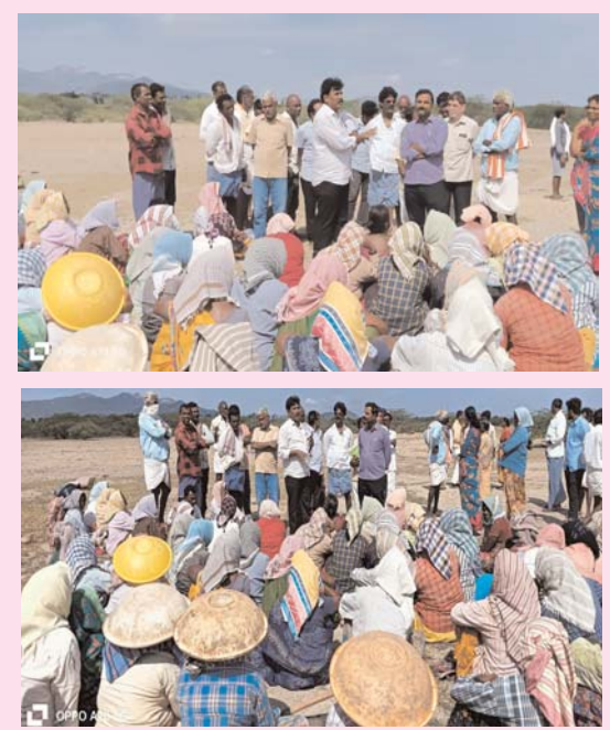
(షణ్ముఖ వెలుగు, మర్రిపాడి, ఆగస్టు 27)