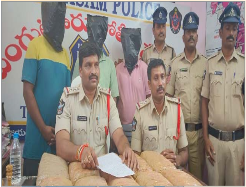
(షణ్ముఖ వెలుగు, టంగుటూరు, ఆగస్టు 27)