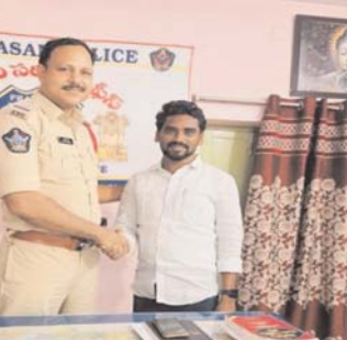
(షణ్ముఖ వెలుగు, హనుమంతునిపాడు, ఆగస్టు 27)