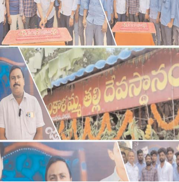
(షణ్ముఖ వెలుగు, పాదిలి, ఆగస్టు 22) మండలంలోని కంభాలపాడులో మెగాస్టార్ చిరంజీవి 69వ జన్మదిన వేడుకలు శ్రీ అంకాలమ్మ తల్లి దేవస్థాన ప్రాంగణంలో చిరంజీవి అభిమానులు ఘనంగా నిర్వహించారు.

మాట్లాడుతూ... కేంద్ర మాజీ మంత్రి, పద్మ విభూషణ్, మెగాస్టార్ కొణిదెల శివ శంకర వరప్రసాద్ ( చిరంజీవి), సినీ రాజకీయరంగంలో మచ్చలేని నాయకుడైన, 150 సినిమాల్లో నటించి, దేశవ్యాప్తంగా మూడువేల అభిమాన సంఘాలు స్థాపించి నేత్రదానం - రక్తదానం కార్యక్రమాలు చేపట్టారన్నారు.