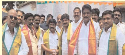
(షణ్ముఖ వెలుగు, పామరూ, ఆగస్టు 22)

మండలంలో ఇన్స్టిట్యూట్ గ్రామంలో గురువారం శ్రీ రామచంద్ర స్వామి కళ్యాణ మహోత్సవాన్ని కార్యక్రమానికి కనిగిరి శాసనసభ్యులు పాల్గొని ప్రత్యేక పూజలు నిర్వహించారు.