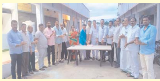
(షణ్ముఖ వెలుగు, పాదిలి, ఆగస్టు 22)

పాదిలిలోని వాసవి పాపింగ్ కాంప్లెక్స్ లోని మానవతా కార్యాలయంలో కమిటీ సభ్యులు, డైరెక్టర్లు పాల్గొని కేక్ కట్ చేసి శుభాకాంక్షలు తెలుపుకున్నారు.