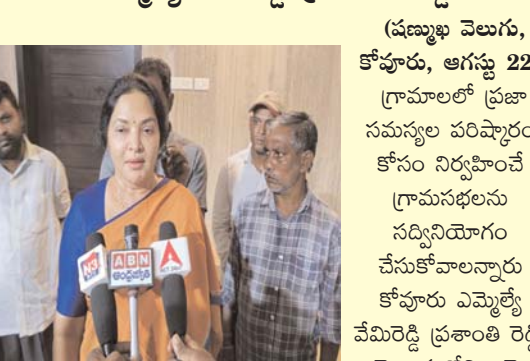
(షణ్ముఖ వెలుగు, కోవూరు, ఆగస్టు 22) గ్రామాలలో ప్రజా సమస్యల పరిష్కారం కోసం నిర్వహించే గ్రామసభలను సద్వినియోగం చేసుకోవాలన్నారు కోవూరు ఎమ్మెల్యే వేమిరెడ్డి ప్రశాంతి రెడ్డి. నెల్లూరులోని ఆమె నివాసంలో మీడియాతో మాట్లాడుతూ పంచాయతీ పరిధిలో గ్రామ సభల ద్వారా సమస్యల నిర్వహణ తీసుకునే ప్రజాస్వామిక సాంప్రదాయాన్ని గత ప్రభుత్వం విస్మరించినదని ఆరోపించారు.

గ్రామసభలు తిరిగి నిర్వహించడం ద్వారా అసత్య సాంప్రదాయాన్ని తిరిగి కొనసాగించాలన్న ముఖ్యమంత్రి శ్రీ చంద్రబాబు నాయుడు ఉప ముఖ్యమంత్రి పవన్ కళ్యాణ్ ఆలోచనల మేరకే ప్రతి పంచాయతీలో గ్రామసభ నిర్వహిస్తున్నట్లు ఎమ్మెల్యే ప్రశాంతి రెడ్డి వెల్లడించారు.