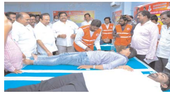
(షణ్ముఖ వెలుగు, ఒంగోలు, ఆగస్టు 22)