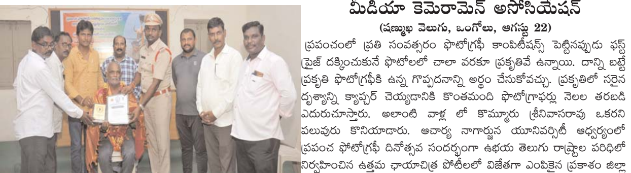
మీడియా కెమెరామెన్ అసోసియేషన్ (షణ్ముఖ వెలుగు, ఒంగోలు, ఆగస్టు 22)

ప్రపంచంలో ప్రతి సంవత్సరం ఫోటోగ్రఫీ కామిటీషన్స్ పెట్టినప్పుడు ఫస్ట్ ప్రైజ్ దక్కించుకునే ఫోటోలలో చాలా వరకూ ప్రకృతివే ఉన్నాయి. దాన్ని బట్టి ప్రకృతి ఫోటోగ్రఫీకి ఉన్న గౌరవనాన్ని అర్థం చేసుకోవచ్చు.