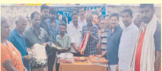
(షణ్ముఖ వెలుగు, పామరూ, ఆగస్టు 23)

మండలంలోని కందుకూరు రోడ్డు సందలి గలసనందా వికలాంగుల సంక్షేమ కార్యాలయంలో గణంగా నిర్వహించడం జరిగింది.