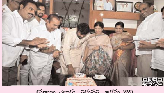
(షణ్ముఖ వెలుగు, తిరుపతి, ఆగస్టు 22)