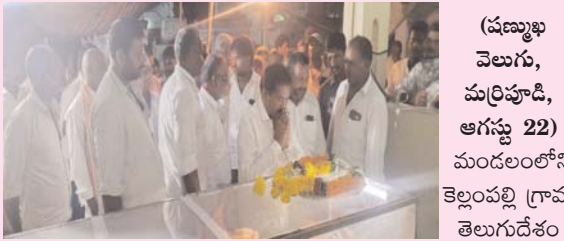
(షణ్ముఖ వెలుగు, మర్రిపాడి, ఆగస్టు 22)