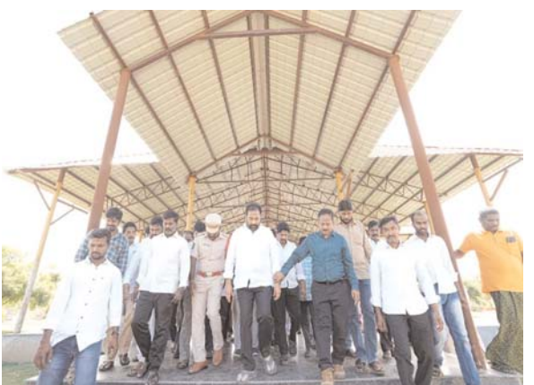
(షణ్ముఖ వెలుగు, నెల్లూరు, ఆగస్టు 22)