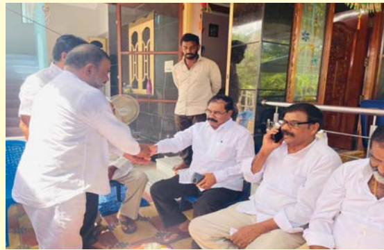
(షణ్ముఖ వెలుగు, నెల్లూరు, ఆగస్టు 21)

కార్పొరేటర్లకు రూరల్ ఇన్చార్జ్ ఆదాల మనోధైర్యం