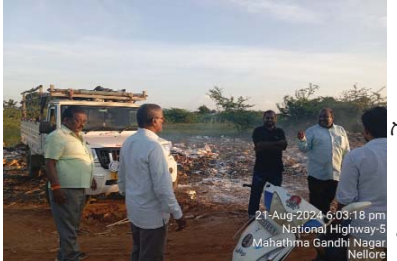
నగర పాలక సంస్థ కమిషనర్, ఆరోగ్య శాఖాధికారి డాక్టర్ చైతన్యతో కలిసి బుధవారం పరిశీలించారు. బహిరంగ ప్రదేశంలో వ్యర్థాలను వేస్తున్న వాహనాలను గుర్తించి జరిమానాలు విధించమని ఆదేశించారు. శానిటేషన్ అధికారులు బుధవారం సాయంత్రం స్థానిక ప్రదేశంలో వ్యర్థాలు వేస్తున్న ఒక వాహనాన్ని గుర్తించి 5 వేల రూపాయల జరిమానా విధించారు. మరోసారి ఇలాంటి చర్యలకు పాల్పడితే చట్టపరమైన చర్యలు తీసుకుంటామని అధికారులు వాహన నిర్వాహకులను హెచ్చరించారు. ఈ కార్యక్రమంలో శానిటేషన్ కార్యదర్శులు, విభాగం సిబ్బంది పాల్గొన్నారు.