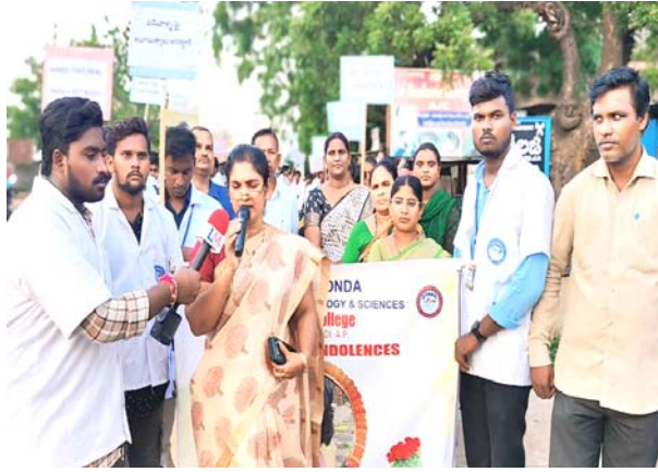
(షణ్ముఖ వెలుగు, పొదిలి, ఆగస్టు 21)

- కలకత్తాలో జూనియర్ డాక్టర్ మోమిత హత్యకు నిరసనగా పొదిలి పట్టణంలో బిట్స్ బీ ఫార్మసీ విద్యార్థులు ర్యాలీ