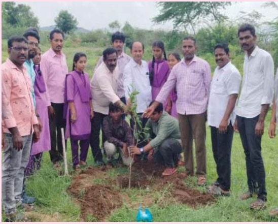
(షణ్ముఖ వెలుగు, కనిగిరి టౌన్, ఆగస్టు 21)