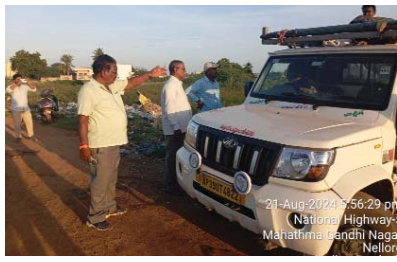
(షణ్ముఖ వెలుగు, నెల్లూరు, ఆగస్టు 21) నెల్లూరు నగర పాలక సంస్థ కమిషనర్ సూర్యతేజ ఆదేశాల మేరకు బహిరంగ ప్రదేశాలలో వ్యర్థాలు వేస్తున్న అసంధికార వాహనాలను గుర్తించేందుకు ప్రత్యేక డ్రైవ్ నిర్వహించారు. అందులో భాగంగా స్థానిక 30వ డివిజన్ రెవెన్యూ కాలనీని