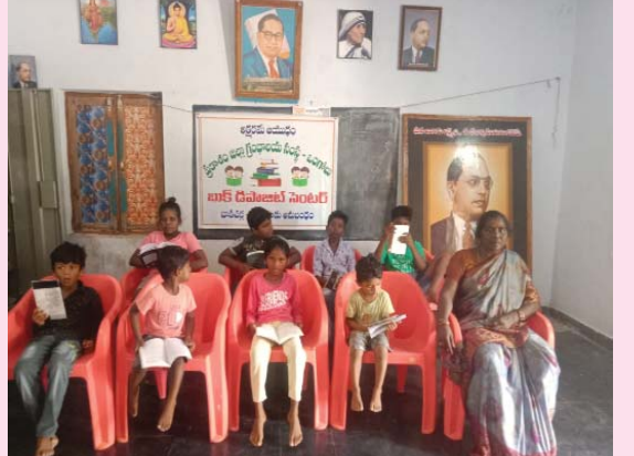
(షణ్ముఖ వెలుగు, ఉలవపాడు, ఆగస్టు 18)