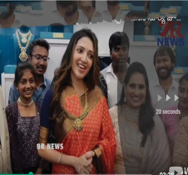
(షణ్ముఖ వెలుగు, నెల్లూరు, ఆగస్టు 18) నెల్లూరులో డిజే టిల్లు హీరోయిన్ నేహాశెట్టి సందడి చేశారు. నగరంలో సూతనంగా ఏర్పాటు చేసిన ఓ జువెలరీ షాపు ఆమె ప్రారంభించారు. జువెలరీ షాపులో ఆభరణాలతో అలంకరించుకుని ఫోటోలకు పోజులిచ్చారు. నెల్లూరుకు వచ్చిన నేహాశెట్టిని చూసేందుకు అభిమానులు పెద్ద సంఖ్యలో తరలివచ్చారు. జువెలరీ షాపులో అన్ని వర్గాలను ఆకట్టుకునే ఆభరణాలు అందుబాటులో ఉన్నాయని నేహాశెట్టి అన్నారు.

నెల్లూరులో డిజే టిల్లు హీరోయిన్ నేహాశెట్టి సందడి