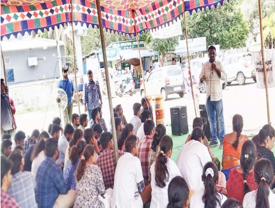
(షణ్ముఖ వెలుగు, ఒంగోలు, ఆగస్టు 18)