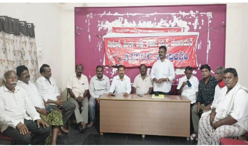
(షణ్ముఖ వెలుగు, ఒంగోలు, ఆగస్టు 12)