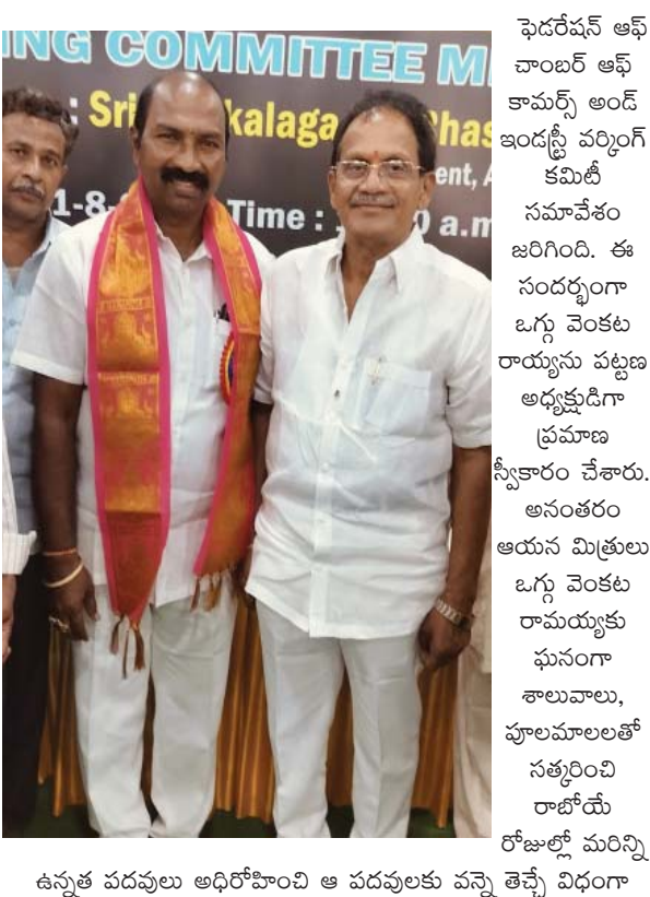
ఉన్నత పదవులు అధిరోపించి ఆ పదవులకు వస్తే తెచ్చే విధంగా కృషి, సేవా కార్యక్రమాలు చేయాలని ఆశాంక్షించారు.