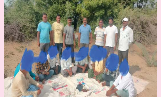
(షణ్ముఖ వెలుగు, పొదిలి, ఆగస్టు 12)

(షణ్ముఖ వెలుగు, పొదిలి, ఆగస్టు 12) మండలంలోని రాజుపాలెం గ్రామ పొలాలలో పేకాట ఆడుతున్నారన్న సమాచారం అందుకున్న పొదిలి ఎస్.ఐ జి కోటయ్య సిబ్బంది కలిసి దాడి చేశారు. ఈ దాడిలో 10మందిని అదుపులోకి తీసుకుని వారి నుంచి రూ.55,800 నగదును సీజ్ చేసి కేసు నమోదు చేసినట్లు ఎస్.ఐ తెలిపారు. ఈ దాడిలో పోలీసు సిబ్బంది పాల్గొన్నారు.