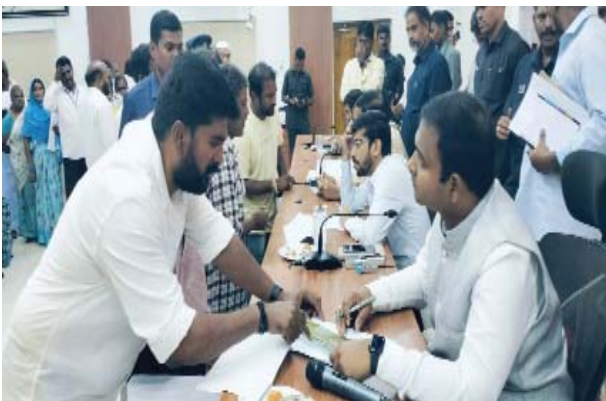
(షణ్ముఖ వెలుగు, నెల్లూరు, ఆగస్టు 9)