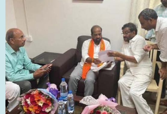
(షణ్ముఖ వెలుగు, నెల్లూరు, ఆగస్టు 9)