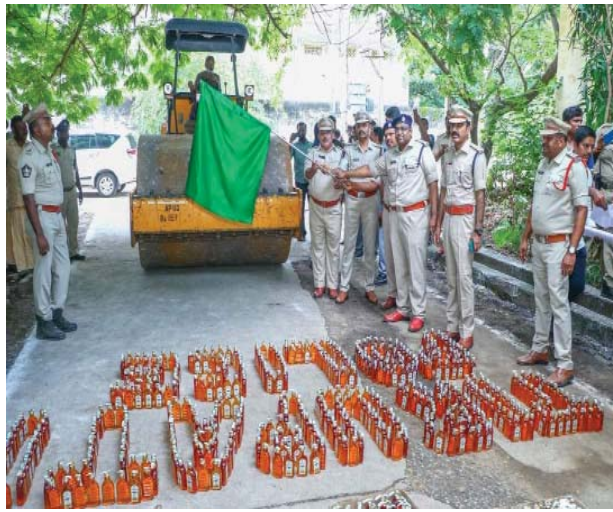
(షణ్ముఖ వెలుగు, సూర్యారామపేట ఇంచార్జ్, ఆగస్టు 9)