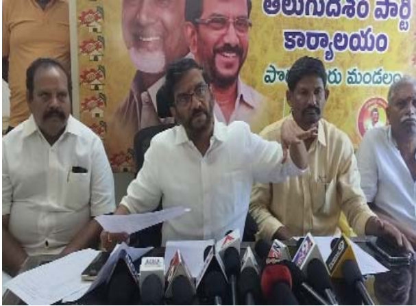
(షణ్ముఖ వెలుగు, నెల్లూరు, ఆగస్టు 9)

నెల్లూరు జిల్లాకు చెందిన ఎమ్మెల్యేలు ఆ శాఖలకు మంత్రులుగా ప్రాతినిధ్యం వహించి నిర్వహించే సర్వేపల్లి ఎమ్మెల్యే సోమిరెడ్డి శంకర్ మోహన్ రెడ్డి అన్నారు. 2014-19 మధ్యకాలంలో ఉద్యాన శాఖ పరిధిలో అమలు చేసే వివిధ స్కీముల ద్వారా జిల్లాలో రూ.1.87 కోట్లు ఖర్చుపెట్టామన్నారు. అదే 2019-24 మధ్య కాలంలో కేవలం రూ.119 కోట్లు మాత్రమే ఖర్చుపెట్టారు. అందులోనూ రూ.1.87 కోట్లు ఆ ప్రభుత్వం బాండ్లు పెట్టగా మా ప్రభుత్వం వచ్చాక మంత్రి అచ్చెన్నాయుడు రైతులకు రూ.1.57 కోట్లు విడుదల చేశారన్నారు. జిల్లాలో మళ్ళీ ఇప్పుడు రూ.10 కోట్లు ఉద్యాన రైతుల కోసం ఖర్చుపెట్టేందుకు ప్రణాళిక సిద్ధం చేశారన్నారు. వైసీపీ పాలనలో తోడేరు రెడ్డి మంత్రిగా వెలగడెట్టి ఉద్యాన రైతుల కోసం మేము ఖర్చుపెట్టిన దాంట్లో మూడో వంతు కూడా ఖర్చుపెట్టలేకపోయారు. సర్వేపల్లి నియోజకవర్గానికి సంబంధించి తీసుకుంటే 2014-15, 2018-19 మధ్యకాలంలో 36.60 కోట్లు ఖర్చు పెడితే, వైసీపీ హయాంలో రూ.18.73 కోట్లు ఖర్చు చేశారు. సామాజిక సాగునీటి గుంతలకు మా ప్రభుత్వ హయాంలో రూ.70 వేలు నుంచి రూ.20 లక్షల వరకు ఉచితంగా ఇచ్చాం. రైతుల కోసం ఎన్నో పథకాలు అమలు చేశాం. మంత్రిగా కాకాణి ఏనాడైనా ఇలా పథకాలు అమలు చేశారా.. కనీసం వారి గురించి తెలుసా. ఎప్పుడైనా ఒక్క సమీక్ష పెట్టి