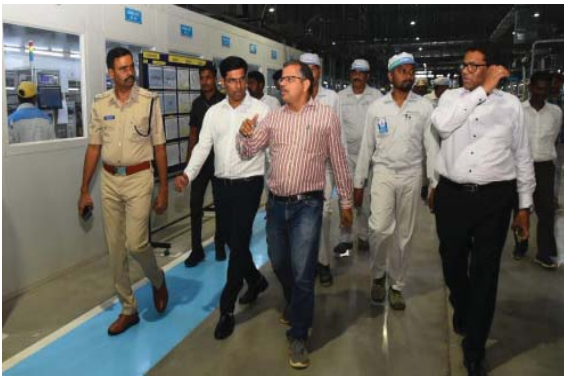
(షణ్ముఖ వెలుగు, తడ, ఆగస్టు 9)