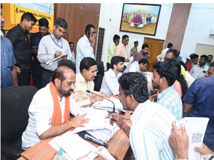
(షణ్ముఖ వెలుగు, నెల్లూరు, ఆగస్టు 9)