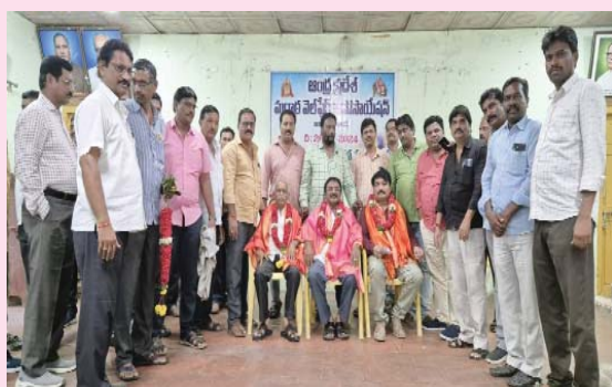
(షణ్ముఖ వెలుగు, ఒంగోలు, జూలై 28)