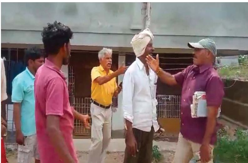
(షాన్ముఖ వెలుగు, ఒంగోలు, జూలై 28)

వీఆర్ఏని సమాచారం అడుగుతుండగా దాడికి యత్నించిన ఆక్రమణదారుడు