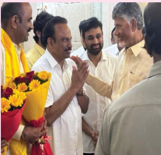
(షణ్ముఖ వెలుగు, ఒంగోలు, జూలై 28)