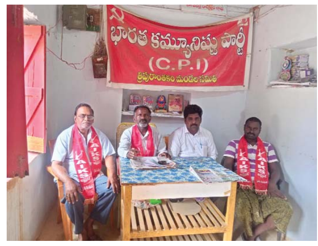
(షణ్ముఖ వెలుగు, త్రిపురాంతకం, జులై 28)

ఉమ్మడి ప్రకాశం జిల్లా ఏర్పడి 54 సంవత్సరాలవుతున్నా అనాడు ఒంగోలు జిల్లా కేంద్రంగా ప్రకాశం జిల్లా గుంటూరు జిల్లాలోని కొంత భాగం నెల్లూరు జిల్లాలోని కొంత భాగం కర్నూలు జిల్లాలోని కొంత భాగాన్ని కలిపి ఒంగోలు కేంద్రంగా ప్రకాశం జిల్లాగా ఏర్పాటు చేయడం జరిగింది. అనాటి నుంచి ఈనాటి వరకు ఈ ప్రాంతం అభివృద్ధి అమడ దూరంలో ఉంది ఒంగోలు కేంద్రానికి పశ్చిమ ప్రాంతం ముఖ్యంగా యర్రగోండపాలెం, గిద్దలూరు, దర్శి ,మార్కాపురం, కనిగిరి, ప్రాంతాల ప్రజలు వారి అవసరాల నిమిత్తం ఒంగోలుకు వెళ్లాలంటే 100 నుండి 150 కిలోమీటర్లు ప్రయాణించి పనులు చేసుకుని రావాల్సి వస్తుంది. అధికారులు సరే టయానికి లేకపోవడం వల్ల ఒకరోజు అదనంగా ఒంగోలు నుండి పనులు చేసుకొని రావాల్సి ఉంది. కథ 50 సంవత్సరాల నుండి మార్కాపురం జిల్లా కేంద్రంగా ప్రకటించి ఈ ప్రాంత ప్రజల ఆకాంక్షలు నెరవేర్చాలని ఎన్నో ఉద్యమాలు జరిగినాయి కానీ జగన్ మోహన్ రెడ్డి కొత్త జిల్లాలు ఏర్పాటు చేసే టైములో మార్కాపురం జిల్లా ఏర్పాటువుతుందని ఈ ప్రాంత ప్రజలు ఎదురుచూశారు కానీ ఈ ప్రాంత ప్రజల ఆకాంక్షను ఏమాత్రం