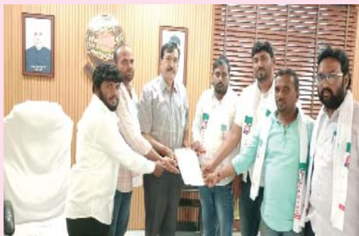
(షణ్ముఖ వెలుగు, సూర్యారావుపేట ఇంచార్జ్, జూలై 28)