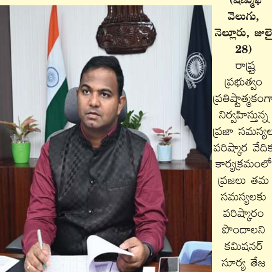
(షణ్ముఖ వెలుగు, నెల్లూరు, జులై 28) రాష్ట్ర ప్రభుత్వం ప్రతిష్టాత్మకంగా నిర్వహిస్తున్న ప్రజా సమస్యల పరిష్కార వేదిక కార్యక్రమంలో ప్రజలు తమ సమస్యలకు పరిష్కారం పొందాలని కమిషనర్ సూర్య తేజ ఆకాంక్షించారు.

ఈ నెల 29వ తేదీ సోమవారం నగరపాలక సంస్థ కార్యాలయంలోని కమాన్డ్ కంట్రోల్ సెంటర్ మీటింగ్ హాల్ లో ఉదయం 10 గంటలకు జరిగే కార్యక్రమంలో ప్రజలు వారి సమస్యల పరిష్కారం కోసం కార్యాలయంలో కమిషనర్ను నేరుగా కలిసి సమస్యలను ఫిర్యాదు చేయవచ్చని తెలిపారు. అందుకున్న సమస్యలను వీలున్నంత త్వరగా పరిష్కారం అందించేందుకు అన్ని విభాగాలను సమన్వయం చేసుకొని కృషి చేస్తామని కమిషనర్ తెలిపారు.