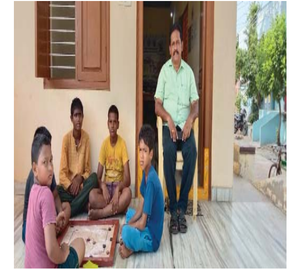
(షణ్ముఖ వెలుగు, ఉలవపాడు, జులై 28)