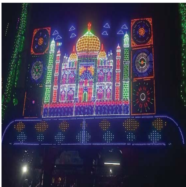
(షణ్ముఖ వెలుగు, తర్లుపాడు, జూలై 17)

అన్ని మతాలకు అతీతమైన మొహరం పండుగ వేడుకలు మండలంలోని తుమ్మలచెరువు, తర్లు పాడు, చెన్నారెడ్డిపల్లి, కలుజువ్వలపాడు, గొల్లపల్లి, పోతలపాడు, గానుగంబం తదితర గ్రామాల్లో అంగరంగ వైభవంగా జరిగాయి. ఈ వేడుకలను తిలకించేందుకు, మొక్క బడులు తీర్చుకునేందుకు సుదూర ప్రాంతం నుంచి భక్తులు అధిక సంఖ్యలో పాల్గొన్నారు. వల్లిమ ప్రాంతమైన తర్లుపాడు మండలంలోని తుమ్మలచెరువు గ్రామంలో వేంచేసి ఉన్న హజరత్ ఖాసీం స్వాములకు ఒక ప్రత్యేకత ఉంది. ఈ స్వాముల వద్ద అపారమైన మహిమలు ఉండడంతో గుంటూరు, విజయవాడ, నంద్యాల, కనిగిరి, నెల్లూరు, కర్నూలు, హైదరాబాద్, నరసరావుపేట తదితర ప్రాంతం నుంచి భక్తులు అధిక