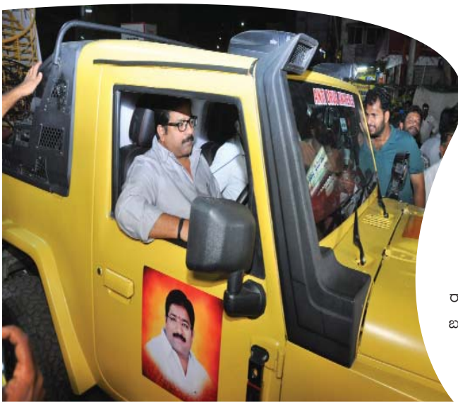
(షణ్ముఖ వెలుగు, ఒంగోలు, జూలై 17)