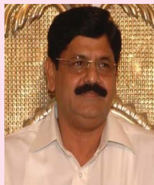
(షణ్ముఖ వెలుగు, నెల్లూరు, జూలై 17)