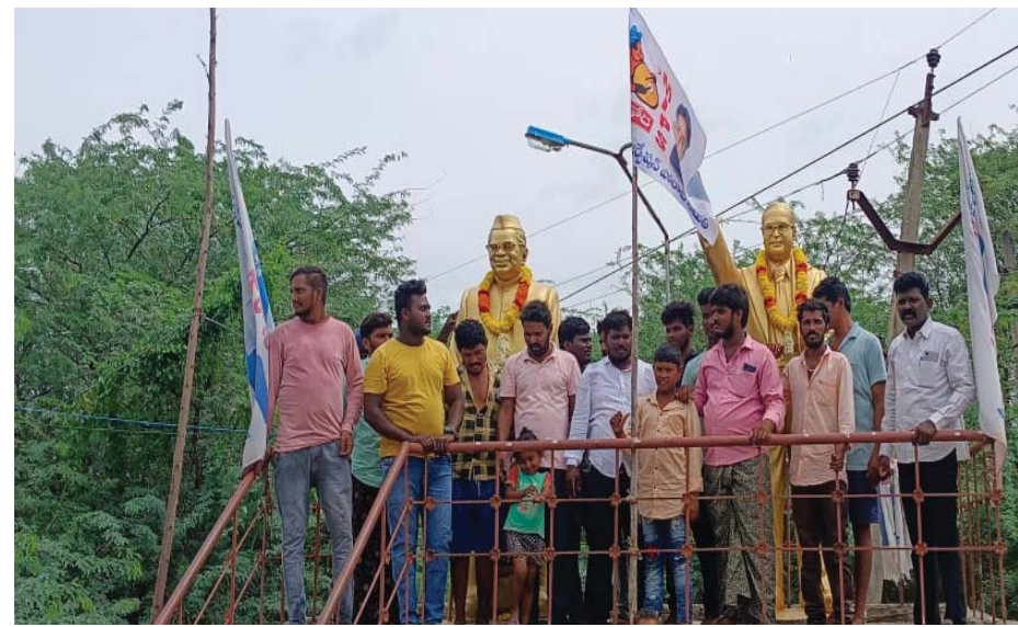
(షాన్ముఖ వెలుగు, ముత్తూరు, జూలై 7)

ముత్తూరు మండలంలోని అన్ని గ్రామ పంచాయతీల్లో ఎమ్మార్పీఎస్ 30 సంవత్సరాల ఆవిర్భావ దినోత్సవం వేడుకలు ఘనంగా నిర్వహించారు. మండలకృష్ణ మాదిగ ఆదేశాల మేరకు జూలై 7వ తేదీ మాదిగ ఆత్మగౌరవ దినంగా పాటించారు. ఈ సందర్భంగా ఎమ్మార్పీఎస్ జెండాను ఆవిష్కరించారు. మండలంలో ప్రధాన గ్రామాలైన ముత్తూరు జిల్లాలోని పేటల శివరామిని పేట గ్రామాల్లో మండలకృష్ణ మాదిగ జన్మదిన వేడుకలు ఘనంగా నిర్వహించారు. ఈ సందర్భంగా