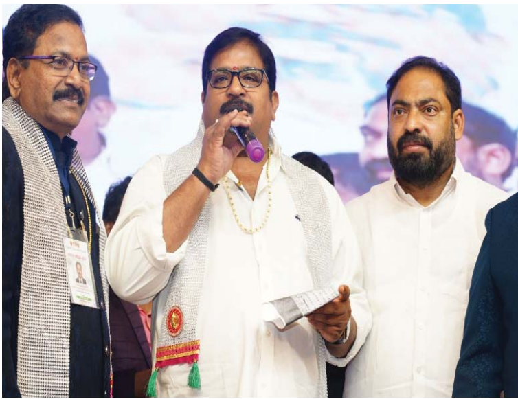
(షణ్ముఖ వెలుగు, ఒంగోలు, జూలై 7)