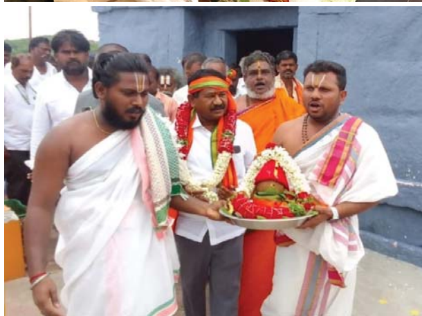
(షణ్ముఖ వెలుగు, మర్రిపూడి, జూలై 6)