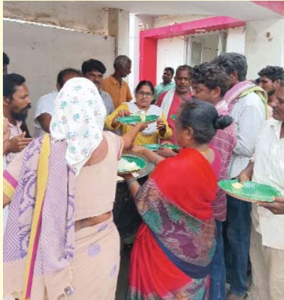
పాటు టీడీపీ నాయకులు, కార్యకర్తలు అన్నదాన కార్యక్రమంలో పాల్గొన్నారు.