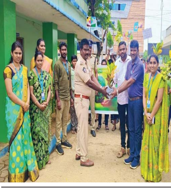
(షణ్ముఖ వెలుగు, సూళ్లూరుపేట ఇంచార్జ్, జులై 6)