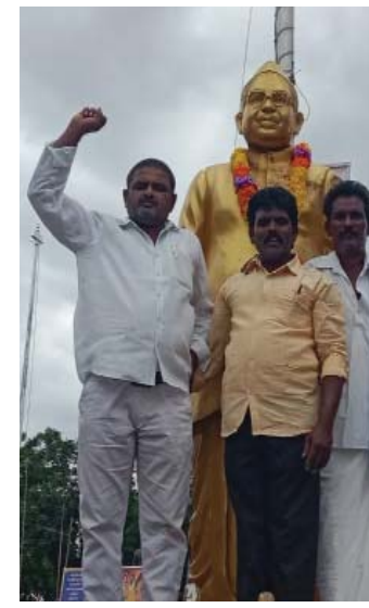
(షణ్ముఖ వెలుగు, మాచర్ల టౌన్, జులై 6)