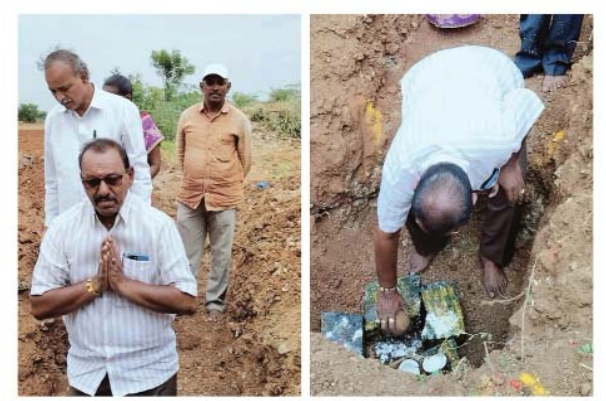
(షణ్ముఖ వెలుగు, పొదిలి, జూలై 6) పొదిలిలో అనేక సేవా కార్యక్రమాల చేస్తూ ప్రజల మన్ననలను