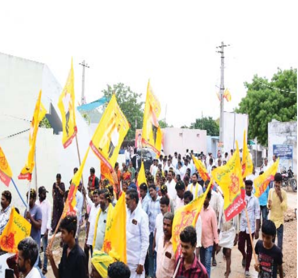
(షణ్ముఖ వెలుగు, మార్కాపురం ఇన్ ఛార్జి, జులై 6)

ఎన్టీసి కూలమి మార్కాపురం ఎమ్మెల్యే గా భారీ మెజార్టీతో విజయం సాధించిన సందర్భంగా మండలంలోని కొలభీమునిపాడు నుంచి తిరుమలకు బోయలపల్లి పోలిరెడ్డి పాదయాత్ర చేపట్టారు. శనివారం