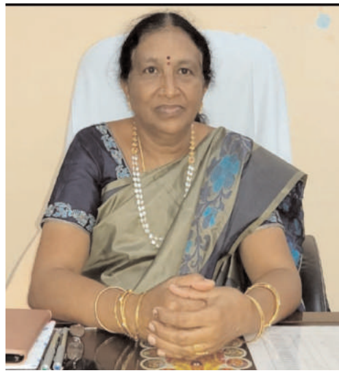
ఉండి శిథిలావస్థలో ఉన్న ఇండ్లను గుర్తించి అందులో ఉన్న ప్రజలను సురక్షిత ప్రాంతాలకు తరలించేందుకు చర్యలు