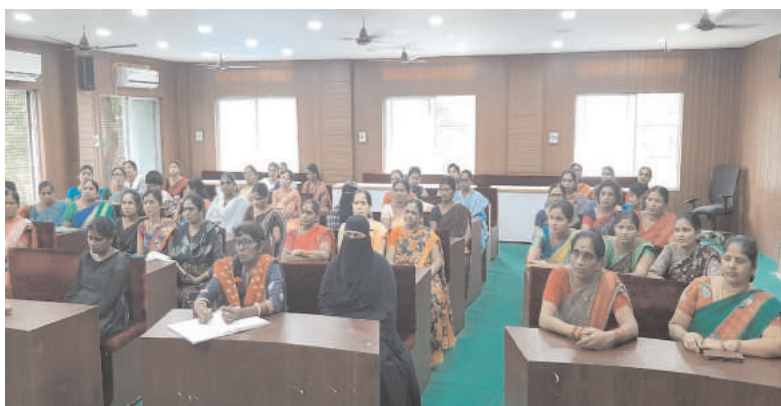
మహిళా మండలి సభ్యులకు మహిళా శక్తి పథకాలను వివరించాలని అలాగే మహిళా అభిరుచి చేయూత అందించాలని మహిళా క్యాంపేన్ శ్రీనిధి లింకేజీ బ్యాంకు లింకేజీ ద్వారా రెండు కోట్ల 20 లక్షల రూపాయలు రుణాలు మున్సిపాలిటీకి నిధులు కేటాయించారని దీనిని సద్వినియోగం చేసుకునేందుకు మహిళా గ్రూపులు ముందుకు రావాలని మహిళా సంఘం సభ్యులు రెండు లక్షల బీమా ప్రమాద బీమా సౌకర్యం 10 లక్షల రూపాయలు వడ్డీ లేని రుణాల సౌకర్యాల ఉన్నాయని దీని ద్వారా లబ్ధి పొందేందుకు ఆదేశ విధంగా వుండ