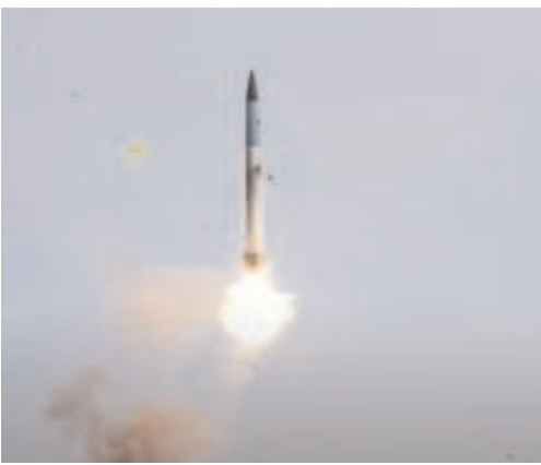
పేర్కొన్నాయి. ఈ కనరత్తులో ఎస్-400 ఎయిర్ డిఫెన్స్ మిసైల్ సిస్టమ్ భారత వైమానిక దళ వ్యవస్థతో సంపూర్ణంగా

రష్యా నుంచి భారత్ కొనుగోలు చేసిన సుదర్శన్ ఎస్-400 ఎయిర్ డిఫెన్స్ క్షిపణి వ్యవస్థ పనితీరు అమోఘం అనిపిస్తోంది. ఇండియన్ ఎయిర్ ఫోర్స్ (ఐఎఎఫ్) కనరత్తులో ఎస్-400 భారీ విజయాన్ని సమోదు చేసింది. శత్రువు పైటర్ ఎయిర్ క్రాఫ్ట్ ప్యాకేజీలో ఏకంగా 80 శాతం విమానాలను కూల్చివేసింది. స్వాతంత్ర్యోని మిగతా విమానాలను సైతం విజయవంతంగా వెనక్కి తరిమికొట్టింది. మొత్తంగా శత్రువు తన మిషన్ ను నిలిపివేసేలా ఎస్-400 సమర్థవంతంగా పనిచేసింది. తన అమ్ములపాదిలోని లాంగ్-రేంజ్ ఎయిర్ డిఫెన్స్ మిసైల్ సిస్టమ్ ను మోహించి ఈ ప్రయోగాన్ని చేపట్టినట్లు ఇండియన్ ఎయిర్ ఫోర్స్ వర్గాలు వెల్లడించాయి. వాయు సేనలో ఎయిర్ డిఫెన్స్ మిసైల్ సిస్టమ్ సంపూర్ణ పరీక్షణను చాటిచెప్పడమే లక్ష్యంగా ఎయిర్ ఫోర్స్ ఈ కనరత్తు నిర్వహించినట్లు సంబంధిత వర్గాలు వివరించాయి. ఎస్-400 ఆయుధ వ్యవస్థ సామర్థ్యాన్ని పరీక్షించేందుకు నిజమైన యుద్ధ విమానాలను ఉపయోగించినట్లు