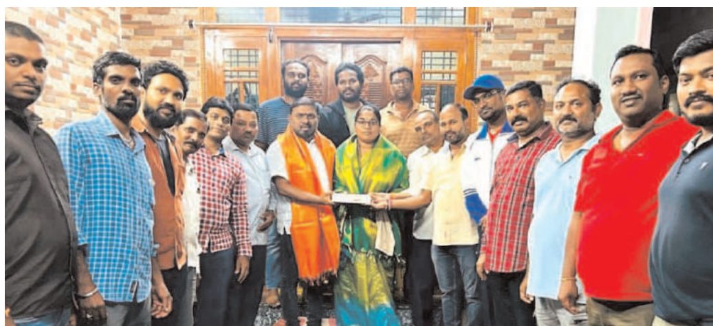
డిప్యూటీ మేయర్ కాలనీలో పర్యటించి సమస్యలు కాలనీ అసోసియేషన్ అధ్యక్ష కార్యదర్శులు సభ్యులు కాలనీ పరిష్కరిస్తారని హామీ ఇచ్చారు. ఈ కార్యక్రమంలో లెక్చరర్స్ వాసులు తదితరులు పాల్గొన్నారు.