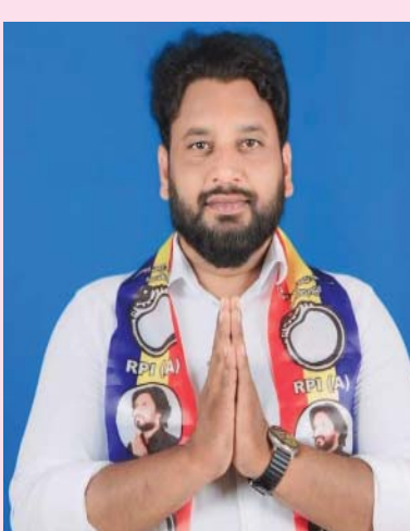
(షణ్ముఖ వెలుగు, ఉలవపాడు, జూలై 26)

ఉలవపాడు మండల పరిధిలో ఆర్.ఎన్.ఎస్, బిజెపి పార్టీకి చెందిన వారు ఎస్సీ, ఎస్టీలను టార్గెట్ చేసి వారిని, రాజ్యాంగంలో ఉన్న హక్కులను వారికి దూరం చేయటం కోసం, చర్చలకు పోతున్న ఎస్సీ, ఎస్టీ ప్రజల ఫోటోలు తీసి