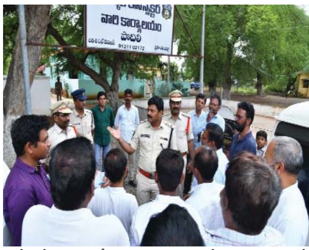
పోలీస్ జెండు బామ్ ట్రీంప్లాంట్ ఇవ్వాలన్నారు. శాంతి భద్రతల విషయంలో కఠినంగా ఉంటామని, రాజకీయాలకు అతీతంగా బాధితవ్వకుండా ఉంటామని తెలిపారు. అనంతరం స్టేషన్ పరిసరాలను, పోలీస్ స్టేషన్ బంకు, సిబ్బంది కార్యాలయంగా రూపుదిద్దుకుంటున్న పాత