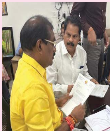
(షణ్ముఖ వెలుగు, యర్రగోండపాలెం ఇన్ ఫార్మా, జూలై 26) అమరావతి సచివాలయంలోని జల వనరుల శాఖ మంత్రి డాక్టర్ నిమ్మల రామానాయుడును కలిసిన