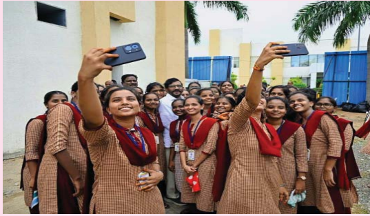
(షణ్ముఖ వెలుగు, మర్రిపూడి, జూలై 26)