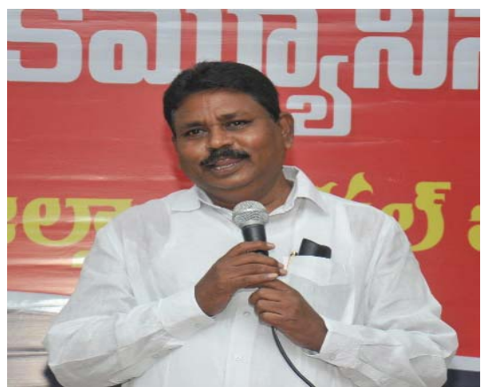
(షణ్ముఖ వెలుగు, ఒంగోలు, జూలై 23)