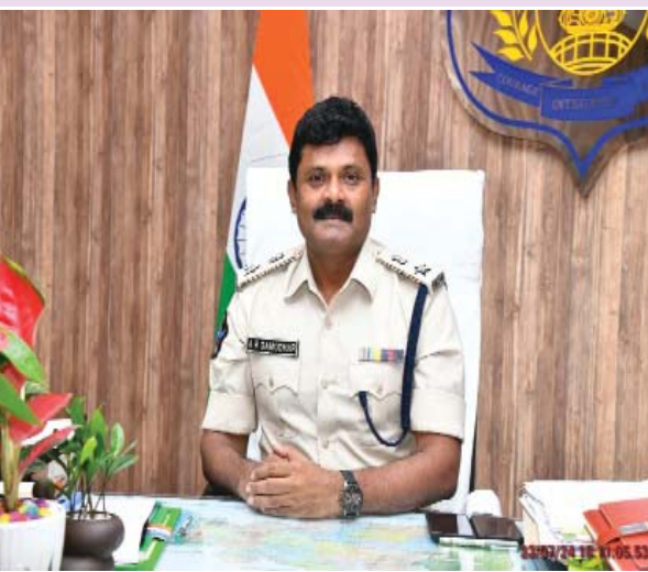
(షణ్ముఖ వెలుగు స్పెషల్ రిపోర్టర్, ఒంగోలు, జూలై 23)

సమాచారం, వీడియోలు, ఫోటోలు పోస్ట్ చేసినా, కుల, మత, రాజకీయ విద్వేషాల రెచ్చగొట్టి శాంతి భద్రతలకు విఘాతం కల్పించేలా ప్రవర్తించినా వారిపై, అడ్మినిస్ట్రేటివ్ ఐటీ యాక్ట్ ప్రకారం తగిన చర్యలు తీసుకుంటామని హెచ్చరించారు. వాహనాలకు అసాధారణ, ట్యాంపరింగ్ (ఫలానా వారి టాలూకా) నెంబర్ షేట్లు వాడారాదని, నెంబర్ షేట్లు యం.వి యాక్ట్ నిబంధనల ప్రకారం ఉండాలని, భయంకరమైన సౌండ్ వచ్చే మాడిఫైడ్ సైలెన్సర్లు, సైరన్స్ అమర్చి శబ్ద కాలుష్యం సృష్టించడమే కాకుండా ఇతర వాహనదారులు, ప్రజలకు అసౌకర్యాన్ని, భయాన్ని కల్గిస్తే చర్యలు తప్పవని, వాహనదారులు ట్రాఫిక్ నిబంధనలు పాటించాలని, మైనర్లకు డ్రైవింగ్ ఇవ్వరాదని, అతి వేగం, మద్యం సేవించి హెల్మెట్ లేకుండా వాహనాలు నడిపి తమ ప్రాణాలతో పాటు ఇతరుల ప్రాణాలకు హాని కలిగించవద్దని సూచించారు. జిల్లాలో ఎక్కడైనా చట్టవ్యతిరేక, అసాంఘిక కార్యకలాపాలపై సమాచారం ఉంటే వెంటనే డయల్ 112, 100 నెంబర్కు, పోలీస్ వాట్సాప్ నెంబర్ 9121102266 ద్వారా సమాచారం అందించాలని జిల్లా ఎస్పీ ప్రజలను కోరారు.