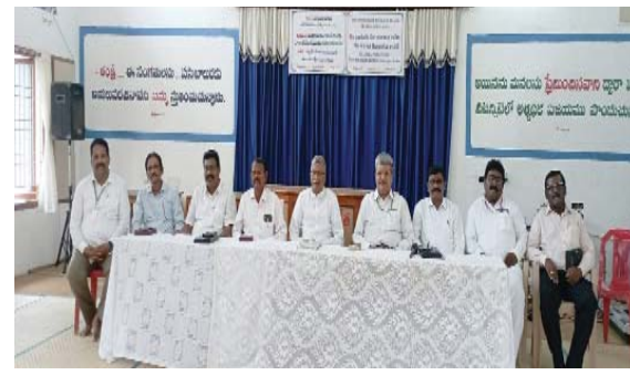
(షణ్ముఖ వెలుగు, ఒంగోలు, జూలై 23)

ఒంగోలు షేక్ము ప్రార్థన మందిరంలో సంఘ కాపరులు సమావేశం