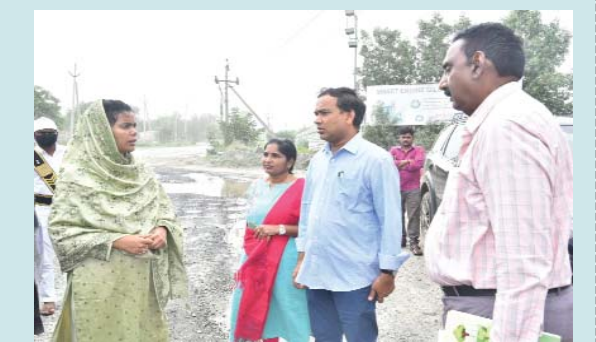
(షణ్ముఖ వెలుగు స్టాఫ్ రిపోర్టర్, ఒంగోలు, జూలై 23)