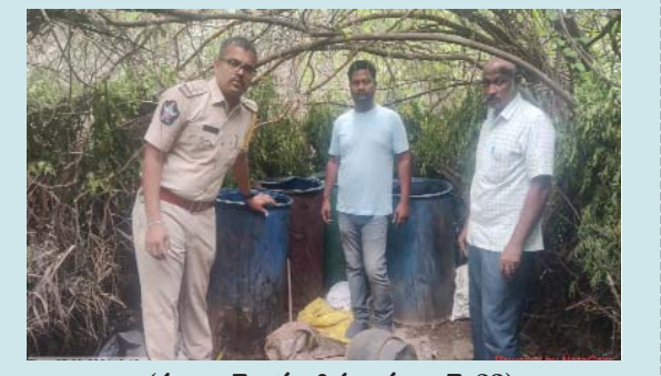
(షణ్ముఖ వెలుగు, గిద్దలూరు, జూలై 23)

మండలంలోని కొంపవీడు గ్రామ సమీపంలో మంగళవారం రహస్యంగా నాలు సారా తయారు చేస్తున్న నాలు సారా స్థావరంపై స్పెషల్ ఎన్ఫోర్స్మెంట్ బ్యూరో అధికారులు ఆకస్మికంగా దాడులు నిర్వహించారు.ఈ సందర్భంగా నాలుసారా తయారు చేసేందుకు సిద్ధంగా ఉంచిన 200 లీటర్ల బెల్లం ఊటను అధికారులు ధ్వంసం చేశారు. అలానే 20 లీటర్ల నాలుసారాను 30 కేజీల బెల్లన్ను అధికారులు స్వాధీనం చేసుకున్నారు. నాలుసారా తయారు చేస్తున్న వ్యక్తిని గుర్తించమని ప్రస్తుతం ఆ వ్యక్తి హరారీలో ఉన్నట్లుగా స్పెషల్ ఎన్ఫోర్స్మెంట్ బ్యూరో సీబి కొండారెడ్డి వెల్లడించారు.ఈ ఘటనపై కేసు నమోదు చేసుకుని దర్యాప్తు చేస్తున్నామన్నారు.