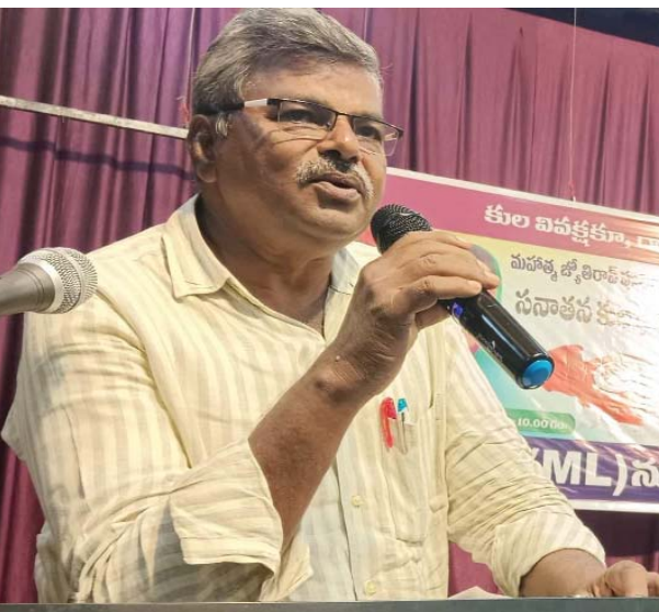
విధంగా వ్యవసాయరంగానికి బడ్జెట్ కేటాయింపులు కేటాయించలేదు. బడ్జెట్ 20 శాతం నిధులను వ్యవసాయ రంగానికి కేటాయించాలని

(షణ్ముఖ వెలుగు, ఒంగోలు, జూలై 23) పార్లమెంటులో ఆర్థిక మంత్రి నిర్మలా సీతారామన్ 2024-25 సంవత్సరానికి సంబంధించి 47.65లక్షల కోట్ల బడ్జెట్ను ప్రవేశపెట్టింది. ఈ బడ్జెట్ మెజారిటీ ప్రజల ఆశలను, ఆకాంక్షలను పట్టించుకోకుండా గాలికి వదిలేసింది. వ్యవసాయాన్ని, ఉపాధిహామీ పథకాన్ని నిర్లక్ష్యం చేసింది. ఇది అన్ని వర్గాలకు సంకేతమిచ్చే బడ్జెట్ అని ప్రభుత్వం చెప్పుకోవడం సిగ్గుచేటైన విషయం. దాదాపుగా బడ్జెట్ ఆదాయంలో 19 శాతం వడ్డీలు చెల్లించడానికే సరిపోతుంది. అలాగే బడ్జెట్ కేటాయింపులో ఆంధ్ర, తెలంగాణ రాష్ట్రాలకు కూడా తీరని అన్యాయం జరిగింది. విభజన హామీ చట్టాన్ని అమలు చేయాలని ఆంధ్రప్రదేశ్ ప్రజలు ఎన్నో ఆందోళనలు, పోరాటాలు చేసినా విభజన హామీల ప్రస్తావన ఈ బడ్జెట్ కనీసంగా లేదు. కాకపోతే బీహార్ జనతాదళ్ (యూ), ఆంధ్రలో (టీడీపీ)లపై నేడు కేంద్రప్రభుత్వం ఆధారపడి వున్నందున కొన్ని వరాలను మాత్రం ప్రకటించింది. బీహార్ జనతాదళ్ (యూ) నాయకులు నితీష్ ప్రత్యేకపాదా కావాలని నోరెత్తినందున వారికి కొన్ని ప్రత్యేక కేటాయింపులు జరిగాయి. ప్రత్యేకపాదాను సాధించడంలో ఆంధ్రలో తెలుగుదేశం, వైసిపి పార్టీలు పూర్తిగా విఫలమయ్యాయి. నరేంద్రమోడికి లొంగి వ్యవహరిస్తున్నాయి. వ్యవసాయదారులను రెట్టింపు చేస్తాన్న నరేంద్రమోడి దానికి తగిన