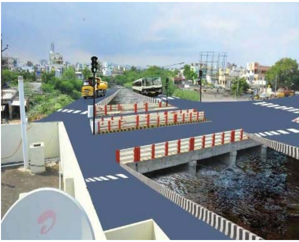
(షణ్ముఖ వెలుగు, ఒంగోలు, జూలై 19)