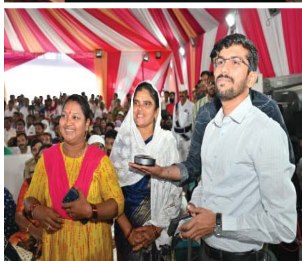
(షణ్ముఖ వెలుగు, నెల్లూరు, జూలై 19)

భవిష్యత్తులో ఇంటర్నేషనల్ ఫెస్టివల్ గా రొట్టెల పండుగను నిర్వహించేందుకు అన్ని విధాలా కృషి చేస్తామని రాష్ట్ర ముఖ్యమంత్రి నారా చంద్రబాబునాయుడు పేర్కొన్నారు. నెల్లూరు బారా షహీద్ దర్గాలో