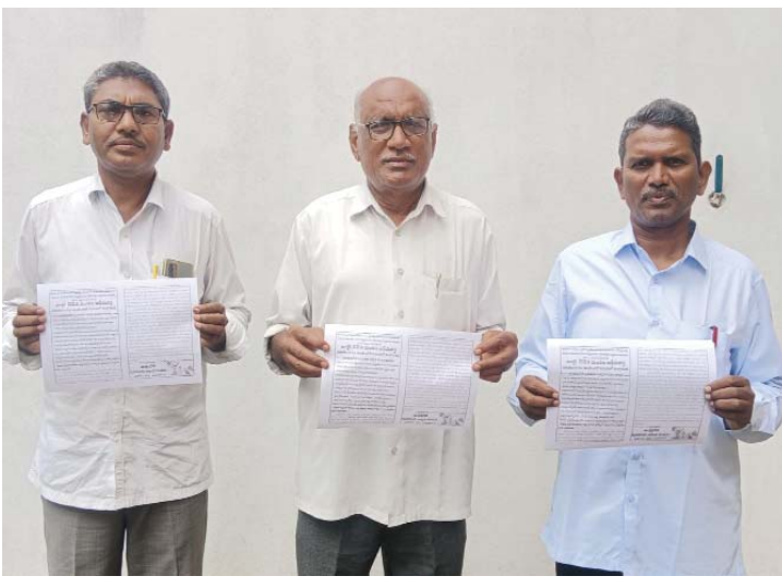
(షణ్ముఖ వెలుగు, ఒంగోలు, జూలై 19)