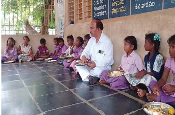
(షణ్ముఖ వెలుగు, కనిగిరి టౌన్, జూలై 19)

ప్రభుత్వ పాఠశాలల్లో మధ్యాహ్నం భోజనం మెనూ ప్రకారం పకడ్బందీగా అమలు చేయాలని కనిగిరి మున్సిపల్ చైర్మన్ అబ్దుల్ గఫార్ అన్నారు. శుక్రవారం కనిగిరి పట్టణంలోని 11వ వార్డులోని ప్రభుత్వ పాఠశాలను మున్సిపల్ చైర్మన్ పరిశీలించి పాఠశాలలోని విద్యార్థులతో మధ్యాహ్నం భోజన పథకం మెనూ ప్రకారంగా సక్రమంగా పెడుతున్నారా? లేదా? అని విద్యార్థులను అడిగి తెలుసుకోగా సక్రమంగానే భోజనం పెడుతున్నారని విద్యార్థులు తెలియజేశారు. ప్రభుత్వ పాఠశాలలోని పరిసరాలు అవరిశుభ్రమగుర్తించి ఉపాధ్యాయులపై ఆగ్రహ వ్యక్తం చేశారు. ప్రభుత్వ పాఠశాలలోని ఆవరణం అవరిశుభ్రంగా ఉంటే విద్యార్థులకు సీజనల్ వ్యాధులు బారిన పడే అవకాశం ఉందని ఆయన తెలియజేశారు. ఈ సందర్భంగా చైర్మన్ మాట్లాడుతూ ప్రభుత్వ పాఠశాలలోని విద్యార్థులకు నాణ్యమైన విద్యతో పాటు పాస్టిక ఆహారం అందించ కుంటే ప్రభుత్వమైన కఠిన చర్యలు తీసుకోవడం జరుగుతుందని ఉపాధ్యాయులకు హెచ్చరించారు.