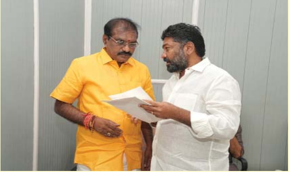
(షణ్ముఖ వేలుగు, నెల్లూరు, జులై 14)