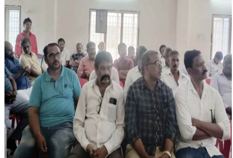
(షణ్ముఖ వెలుగు, ఒంగోలు, జులై 14)