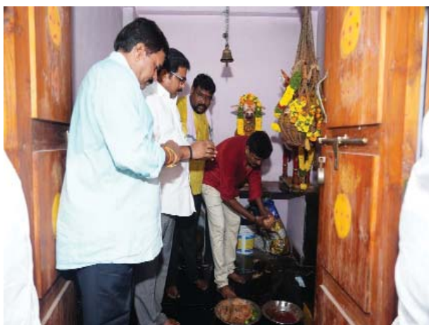
పాల్గొన్నారు. ఒంగోలు నగరంలోని 6వ డివిజన్ లోని దేవర ఇంటి వద్ద కొటారి వారి మొక్కలు కార్యక్రమంలో పాల్గొన్నారు. ఒంగోలు నగరంలోని 15వ డివిజన్ పార్క్ వద్ద ఆషాఢ మాసం సందర్భంగా