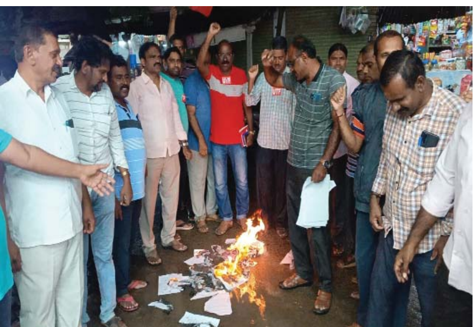
(షణ్ముఖ వేలుగు, పొదిలి, జులై 14)