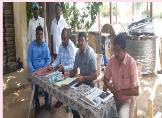
(షణ్ముఖ వెలుగు, మర్రిపూడి, జూలై 11)