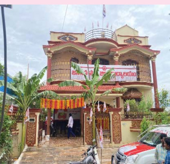
(షణ్ముఖ వెలుగు, నెల్లూరు, జూలై 11)