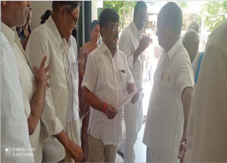
(షణ్ముఖ వెలుగు, కనిగిరి, జూలై 11)

సమూర్ స్టోరేజ్ ట్యాంకుల నిర్మాణం చేపట్టాలి కనిగిరి నియోజకవర్గ సమస్యలు పరిష్కరించాలంటూ ఎమ్మెల్యే ఉగ్రకు వామపక్షాల, ప్రజాసంఘాల ఐక్యవేదిక విన్నవం