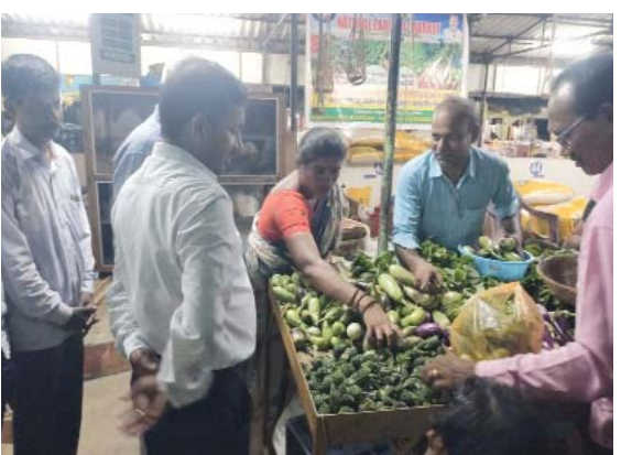
(షణ్ముఖ వెలుగు, ఒంగోలు, జూలై 10)