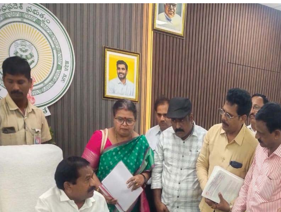
(షణ్ముఖ వెలుగు, అమరావతి, జూలై 10)

వసతి గృహాల్లో ఖాళీలు త్వరలో భర్తీచేస్తాం రాష్ట్ర సాంఘిక సంక్షేమ శాఖ మంత్రి డాక్టర్ డోలా శ్రీ బాల వీరాంజనేయస్వామి