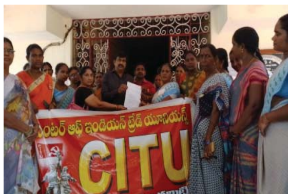
(షణ్ముఖ వెలుగు, ఉలవపాడు, జూలై 10)

సీబీఐయూ ఆధ్వర్యంలో అంగన్వాడీల డిమాండ్స్ డే సందర్భంగా ధర్మా, తహసీల్దార్ కు వినతి