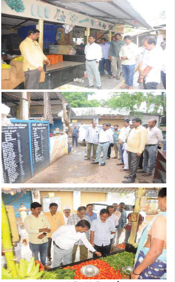
(షణ్ముఖ వెలుగు స్టాఫ్ రిపోర్టర్, ఒంగోలు, జూలై 9)