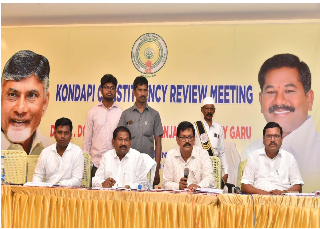
(షణ్ముఖ వెలుగు, జూన్ 29)