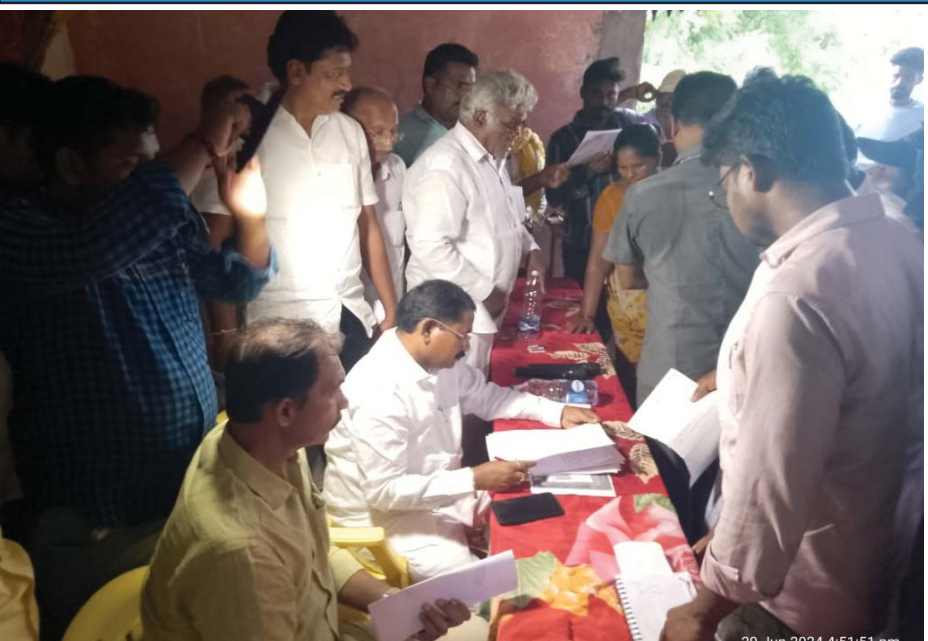
(షణ్ముఖ వెలుగు, జరుగుపల్లి, జూన్ 29)

సమస్యల పరిష్కారం కోరుతూ మంత్రికి విన్నపాల వెల్లువ