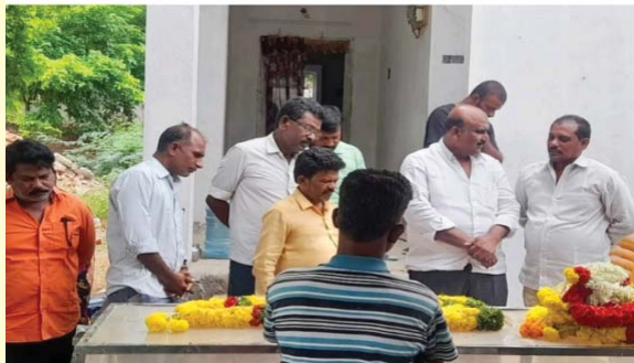
(షణ్ముఖ వెలుగు, పొదిలి, జూన్ 29)