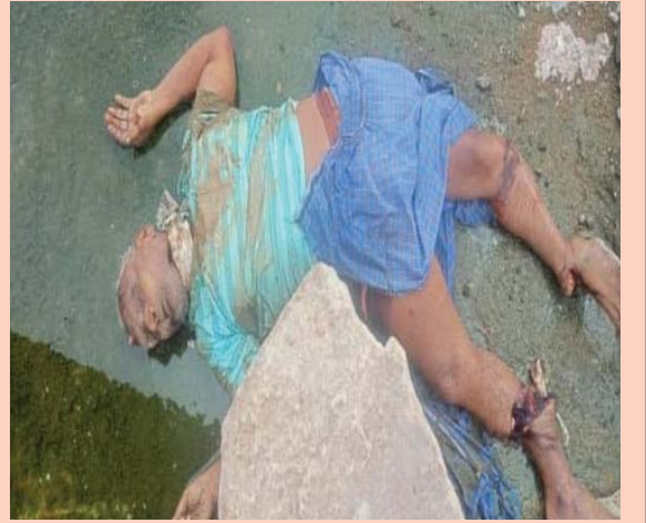
(షణ్ముఖ వెలుగు, విజయపురి సౌత్, జూన్ 29)

నాగార్జునసాగర్ పోలీసు స్టేషన్ పరిధిలో కృష్ణానదిపై గల కొత్త ట్రిడ్స్ పివీ వైపు నుంచి 4వ ఫిల్డర్ ప్రక్కను తక్కువ నీరు కలిగిన నీటి గుంతలో ఒక గుర్తు తెలియని మరూరు 65-70 సంవత్సరాల వయసు కలిగిన మగ మృతదేహం పడి ఉండి రెండు కాళ్ళు విరిగిపోయి ఉన్నాయి. శవం పైన ముదురు ఆకుపచ్చ చారలు గల తేత ఆకు పచ్చ రంగు డి షర్టు, నీలి రంగు కాఫీ రంగు గళ్ళు కలిగిన లుంగీ, కాఫీ రంగు కలిగిన యువరాజ్ కంపెనీ కి చెందిన ఫుట్ డ్రాయర్ ధరించబడి ఉన్నాయి. మెడకు తెల్లని కట్టు కట్టబడి ఉంది. మృతదేహం యొక్క ఆహుతి తెలిసినవారు నాగార్జునసాగర్ ఎస్ఐ 9440900884, నాగార్జునసాగర్ పోలీస్ స్టేషన్ 08642 278219, మాచర్ల రూరల్ సిఐ 9440796229 అను నెంబర్లకు సంప్రదించవచ్చుననిగా కోరారు.