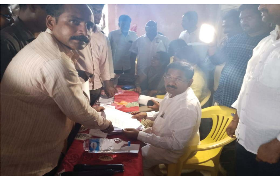
29-Jun-2024 5:12:47 pm