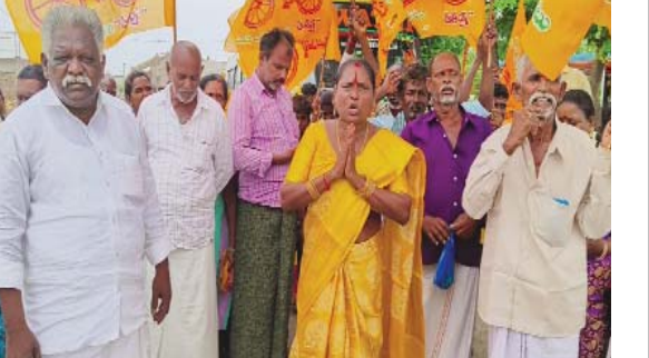
(షణ్ముఖ వెలుగు, పాస్చలూరు, జూన్ 29)