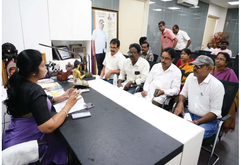
(షణ్ముఖ వెలుగు, కోవూరు, జూన్ 29) జూలై 1న పెన్షన్ల పంపిణీ సమర్థవంతంగా నిర్వహించాలని కోవూరు ఎమ్మెల్యే ప్రశాంతిరెడ్డి కోవూరు నియోజకవర్గ ఎంపీడీఓలను ఆదేశించారు. శనివారం నెలవారూ కోవూరు, నివాసంలో నియోజకవర్గ పరిధిలోని కోవూరు, బుచ్చిరెడ్డి పాలెం, విడవలూరు, కొడవలూరు, మరియం ఇందుకూరుపేట ఎంపీడీఓలతో ఎమ్మెల్యే ప్రశాంతిరెడ్డి సమీక్ష సమావేశం నిర్వహించారు. సచివాలయ సిబ్బందిని సమన్వయం చేసుకొని స్థానిక నాయకుల సహకారంతో పెన్షన్ల పంపిణీ కార్యక్రమాన్ని విజయవంతం చేయాలని ఎమ్మెల్యే సూచించారు. మండల అధికారులు,

కోవూరు నియోజకవర్గ ఎంపీడీఓలతో సమీక్ష సమావేశం అధికారులకు సూచనలు చేసిన ఎమ్మెల్యే