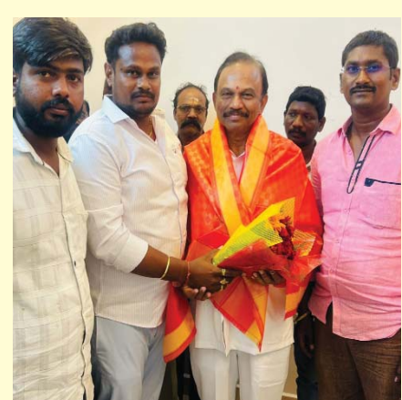
(షణ్ముఖ వెలుగు, ఒంగోలు, జూన్ 29) ఇటీవల ప్రకాశం జిల్లా ఎంపీగా పార్లమెంటులో ప్రమాణ స్వీకారం చేసి తొలిసారిగా ఒంగోలు కి వచ్చిన