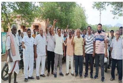
(షణ్ముఖ వెలుగు, పొదిలి, జూన్ 21) పొదిలి పట్టణంలో ప్రపంచ యోగా దినోత్సవం సందర్భంగా యోగా ఆభిమానులు స్థానిక గోశాల నుంచి

ఆరోగ్యంగా ఉండండి దబ్బులు సంపాదించి కాని ఆరోగ్యం సంపాదించలేం ప్రతి ఒక్కరు యోగా,వ్యాయమం చేయండి ప్రపంచం యోగా దినోత్సవం సందర్భంగా పొదిలిలో బైక్ ర్యాలీ