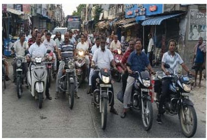
విశ్వనాథపురం జూనియర్ కాలేజ్ బైక్ ర్యాలీ నిర్వహించారు. ఈ సందర్భంగా ప్రతి ఒక్కరూ యోగా చేయడం వలన

మానసిక ప్రశాంతత, ఆరోగ్యం వస్తాయన్నారు. బిజినెస్లో పడి ఆరోగ్యాన్ని నిర్లక్ష్యం చేయకుండాను నూచించారు. ఈ సందర్భంగా యోగా ఆభిమానులు పెద్ద ఎత్తున పాల్గొని ప్రజలకు అవగాహన కల్పించారు. వలుపురు యోగా విశిష్టత గురించి తెలియజేస్తూ ఎన్నో పాఠాలు ఉన్నాయని తెలిపారు. అనంతరం క్రమం తప్పకుండా యోగా చేస్తూ ప్రజలకు జ్యోతిషకలకు అవగాహన కల్పిస్తున్న కొందరిని యోగా ఆభిమానులు సన్మానించారు. ఈ కార్యక్రమంలో పట్టణంలోని పలువురు రాజకీయ నాయకులు, వ్యాపారులు, ఉద్యోగులు, తదితరులు పాల్గొన్నారు.