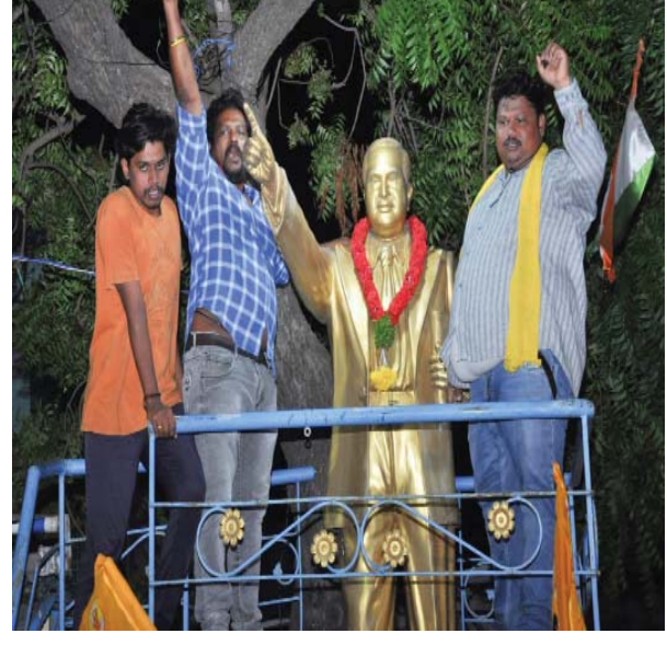
(షణ్ముఖ వెలుగు, ఒంగోలు, జూన్ 13)