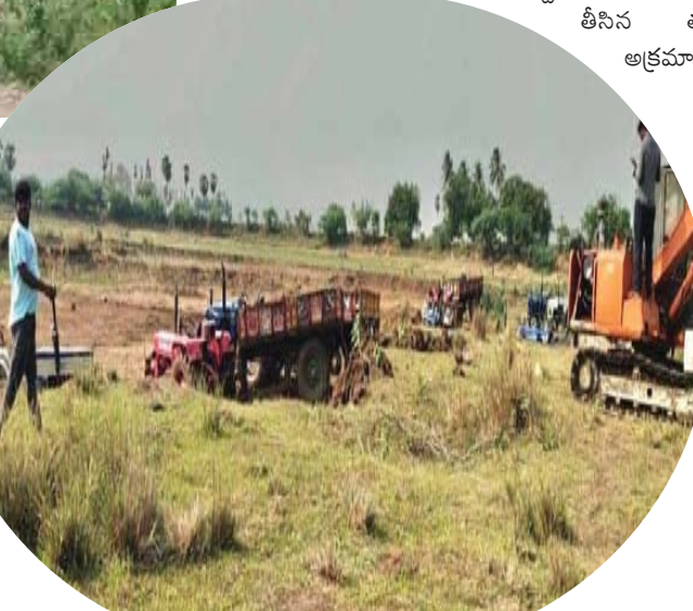
వాటిని మట్టి పూడ్చివేసి సాగు చేస్తున్నారు. ఇదంతా అధికారులు చూసినా చేసేదేమీలేక మిన్నకుండిపోతున్నారు. ఈ రెండు మండలాల్లో అధికారిక లెక్కల ప్రకారమే వివిధ చెరువుల్లో 650 ఎకరాలను అక్రమించి చెరువు భూములను

రెండు మండలాల్లో.. యర్రగోండపాలెం, పుల్లలచెరువు మండలాల్లో అక్రమార్కులు చెరువుల భూములు దర్జాగా కట్టా చేస్తున్నారు. ఇరిగేషన్, రెవెన్యూ అధికారులు కలిసి గతంలో చెరువులను సర్వే చేసి వాటి పూర్తి విస్తీర్ణం పరకు హద్దులు నిర్ణయించి బొందరి పేరుతో స్ట్రైప్స్ తవ్వారు. ఇందు కోసం లక్షలాది రూపాయలు ఇరిగేషన్ శాఖ ఖర్చు పెట్టింది. కానీ స్ట్రైప్స్ తీసిన తర్వాత అక్రమార్కులు