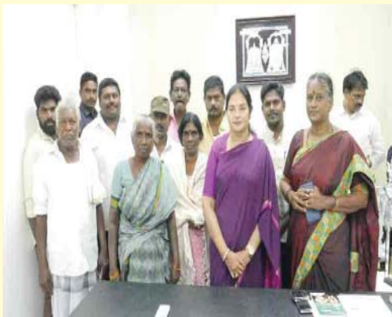
(షణ్ముఖ వెలుగు, నెల్లూరు, జూన్ 13)