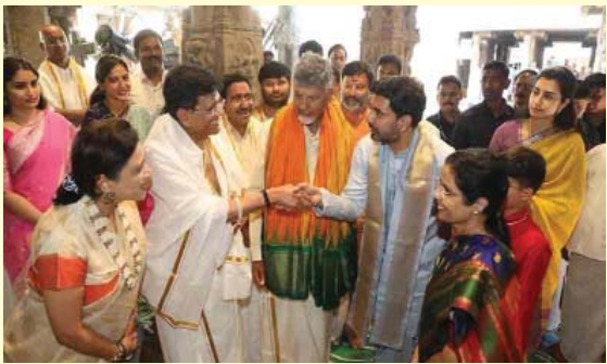
(షణ్ముఖ వెలుగు, నెల్లూరు, జూన్ 13)