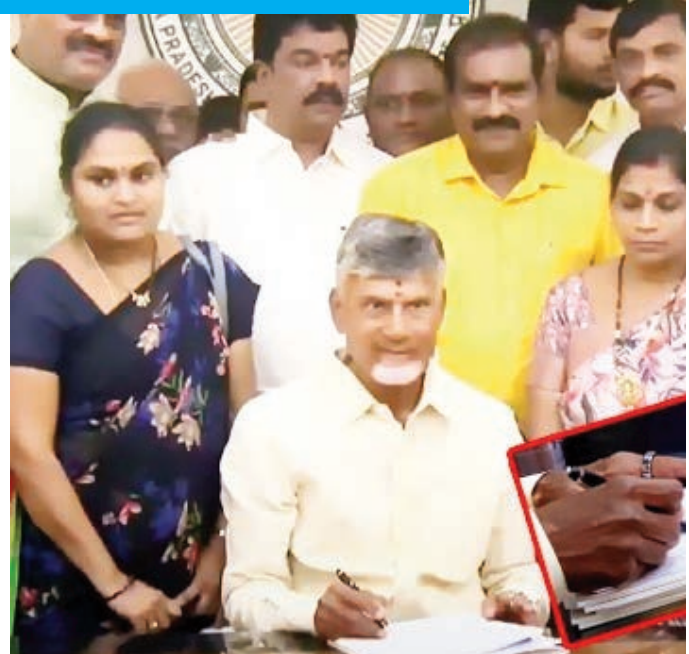
తిరుమలను ఐదేళ్లలో బ్రష్టు పట్టించారు

బాధ్యతలు స్వీకరించిన సిఎం చంద్రబాబు మెగా డిఎస్సీ.. ల్యాండ్ టైటిలింగ్పై మలి సంతకం