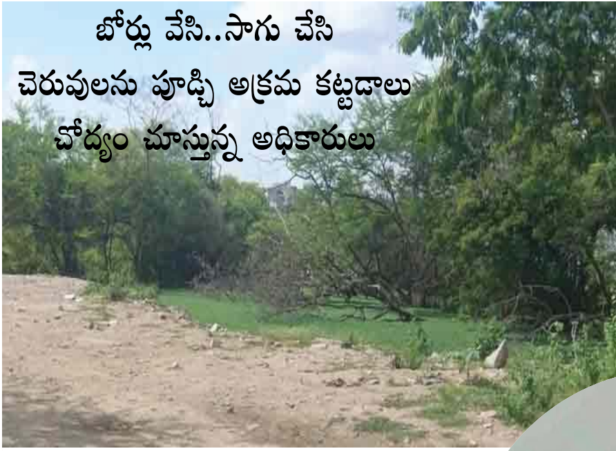
బోర్లు వేసి..సాగు చేసి

చెరువులను పూడ్చి అక్రమ కట్టడాలు చోద్యం చూస్తున్న అధికారులు