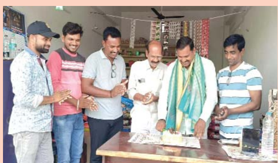
(షణ్ముఖ వెలుగు, మెట్పల్లి ప్రతినిధి, జూన్ 3)