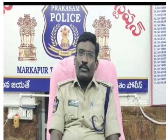
(షణ్ముఖ వెలుగు, మార్కాపురం ఇన్ ఛార్జ్, జూన్ 3)