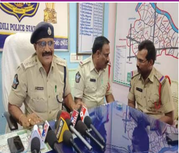
(షణ్ముఖ వెలుగు, పొదిలి, జూన్ 3)