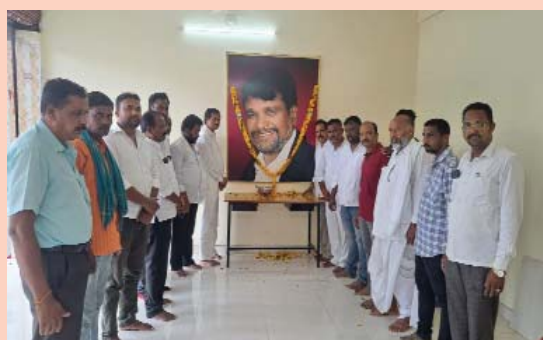
(షణ్ముఖ వెలుగు, మెట్పల్లి ప్రతినిధి, జూన్ 3)