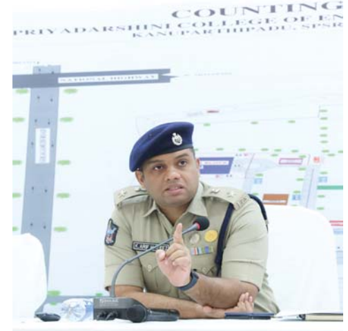
(షణ్ముఖ వెలుగు, నెల్లూరు, జూన్ 3)

సార్వత్రిక ఎన్నికల కౌంటింగ్ సందర్భంగా ఉమ్మడి చంద్ర కాన్వెన్షన్ హాల్ నందు జిల్లా పోలీసు అధికారులకు జిల్లా ఎస్పీ ఆర్ ఐపి హాఫ్ హౌస్ బ్రీఫింగ్ నిర్వహించి దిశానిర్దేశం చేశారు.