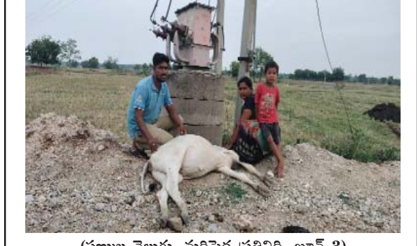
(షణ్ముఖ వెలుగు, మరిపెడ ప్రతినిధి, జూన్ 3) మరిపెడ మండలం చింతల గడ్డ తండ్ల గ్రామంపందాయతీ పరిధిలోని రేఖ్య తండాకు రైతు బానోతు రవికి చెందిన ఆవు తండా శివారులోని గడ్డి మేయడానికి వెళ్ళింది. అక్కడ తక్కువ ఎత్తులో ఉన్న ట్రాన్సామర్మర్ వద్ద గడ్డిమేస్తూ తగలడంతో అక్కడికక్కడే మృతి చెందింది. మృతిచెందిన ఆవు విలువ రూ.30 వేలు ఉంటుందని రైతు బోరుస విలపించారు.