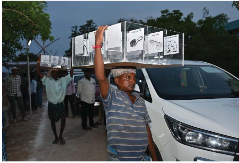
ఓట్లు, ఇతరుల ఓట్లు 70 మొత్తం 15,48,183 ఓట్లు పోలయ్యాయని కలెక్టర్ వెల్లడించారు. కందుకూరు అసెంబ్లీ నియోజకవర్గ ఓట్ల లెక్కింపు ఫలితాలు 20 రౌండ్లలో, కావలి ఫలితాలు 23 రౌండ్లు, అత్మకూరు ఫలితాలు 20 రౌండ్లు, కోవూరు ఫలితాలు (తరువాతి 4లో...)

నేడే సార్వత్రిక ఎన్నికల ఓట్ల లెక్కింపు ఏర్పాట్లు పూర్తిచేసిన జిల్లా యంత్రాంగం నేటి ఉదయం 8 గంటలకు కౌంటింగ్ ప్రారంభం ఒక్కో అసెంబ్లీ నియోజకవర్గానికి ఈవీఎం ఓట్ల లెక్కింపును 14 టేబుళ్లు ఏర్పాటు రౌండ్ల వారీగా ఫలితాలు వెల్లడి కౌంటింగ్ కేంద్రానికి చేరిన పోస్టల్ బ్యాలెట్ బాక్సులు జిల్లా ఎన్నికల అధికారి, కలెక్టర్ ఎం హరినారాయణన్