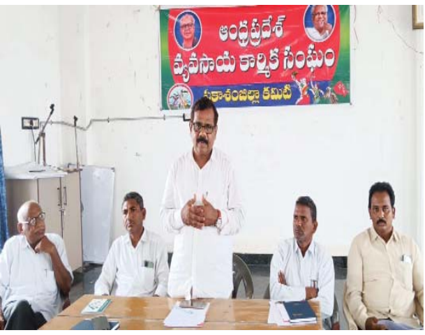
(షణ్ముఖ వెలుగు, ఒంగోలు, జూన్ 3)