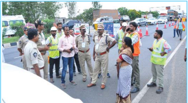
(షణ్ముఖ వెలుగు, ఒంగోలు, జూన్ 3)

నాలుగో తేదీన జరగనున్న సార్వత్రిక ఎన్నికల కౌంటింగ్ ఉండడంతో, కౌంటింగ్ రైస్ కాలేజీ వద్ద ఉండడంతో నేషనల్ హైవే పై వచ్చే వాహనాలను దైవర్షన్ చేసి ట్రాఫిక్ ను అధికారులు మళ్లించారు.