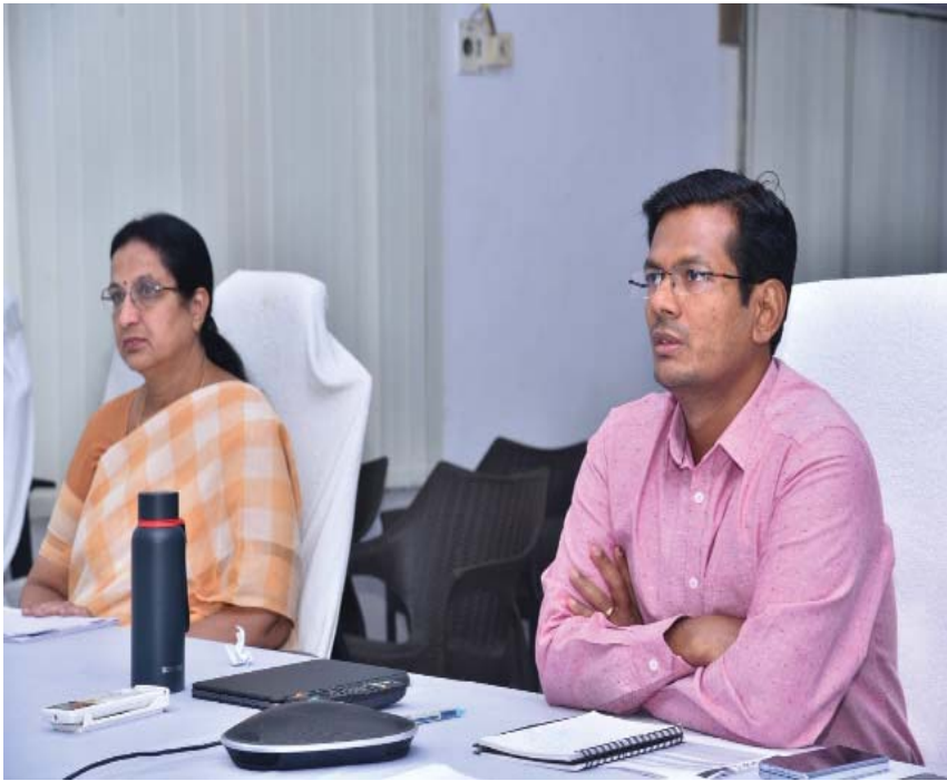
(షాన్ముఖ వెలుగు స్టాఫ్ రిపోర్టర్, ఒంగోలు, జూన్ 2)