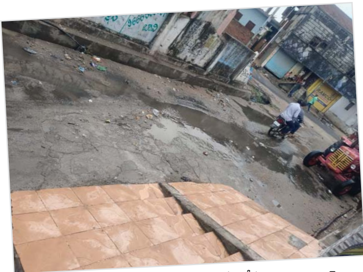
(షాన్ముఖ వెలుగు, కోరుట్ల ప్రతినిధి, జూన్ 2)

జగిత్యాల జిల్లా కోరుట్ల మున్సిపాలిటీ పరిధిలో ఉన్న 4వ వార్డు అంబేద్కర్ నగర్ లో చిన్నపాటి వర్షానికే డ్రైనేజీ మురికి నీరు ఇండ్ల లోకి వస్తుంది. గతంలో ఇలా జరగడం వలన మున్సిపల్ అధికారులకు చెప్పినా కనీసం వార్డులో ఎలా ఉందో చూడడానికి కూడా ఎవరు రాలేదని ఆ ప్రాంత ప్రజలు చెబుతున్నారు. దీంతో వార్డును పట్టించుకోని అధికారులు మాకు ఎందుకు అని వార్డు ప్రజలు అందోళనకు దిగారు.