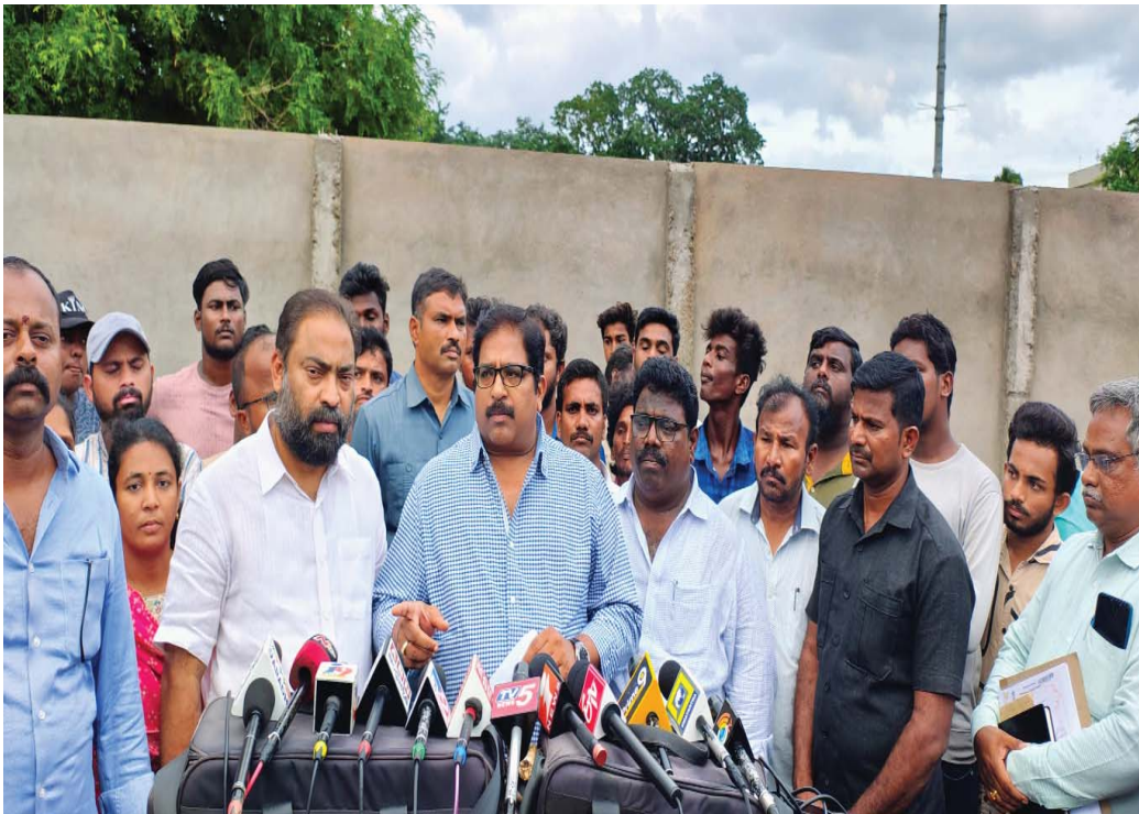
(షాన్ముఖ వెలుగు, ఒంగోలు, జూన్ 24)