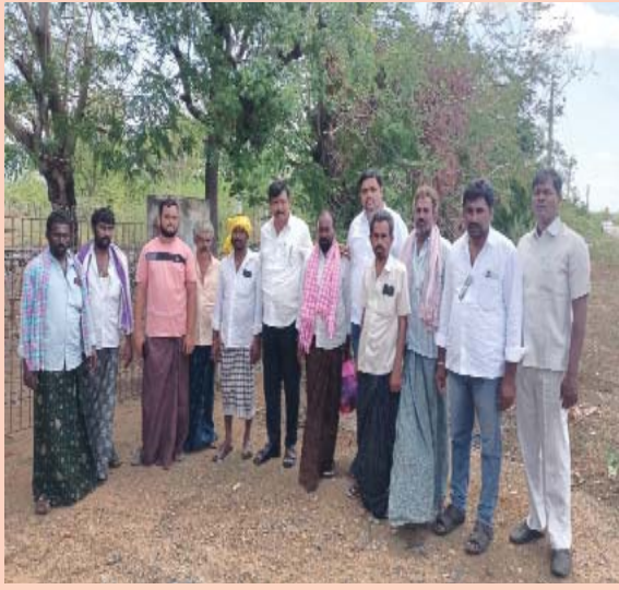
(షాన్ముఖ వెలుగు, వెంకటగిరి, జూన్ 17)