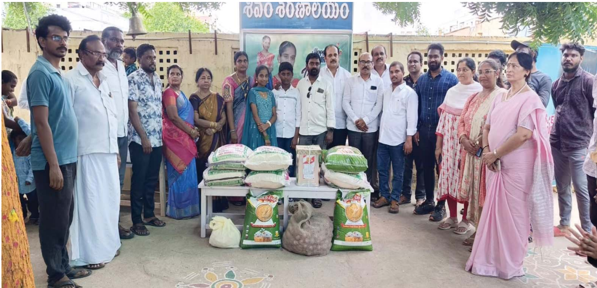
(షణ్ముఖ వెలుగు, ఒంగోలు, జూన్ 17)