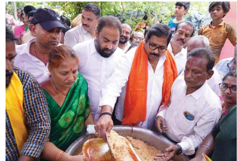
(షణ్ముఖ వెలుగు, ఒంగోలు, జూన్ 17)

పేదలకు ఆహారం అందించే ఏర్పాట్లు పేదోడు కడుపు నింపేది టీడీపీనే త్వరలో రూ.5కే అన్న క్యాంటీన్ ద్వారా పేదోడికి అన్నం ఒంగోలు ఎమ్మెల్యే దామచర్ల