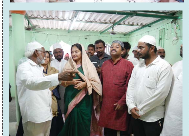
(షణ్ముఖ వెలుగు, నెల్లూరు, జూన్ 17)