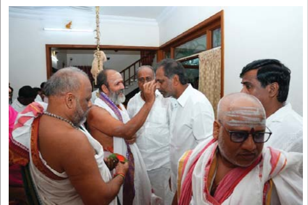
(షణ్ముఖ వెలుగు, అద్దంకి, జూన్ 17)

విద్యుత్ శాఖ మంత్రి గొట్టిపాటి రవికుమార్ ను సంగరకొండ శ్రీ ప్రసన్నాంజనేయ స్వామి దేవస్థాన ఈడి, వేద పండితులు మద్దాదపూర్వకంగా కలిసారు. అనంతరం ఆయనకు స్వామి వారి ఆశీర్వాదాలు అందించారు.