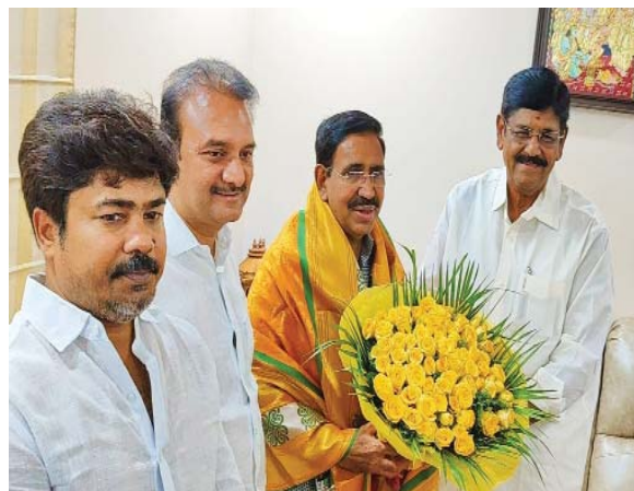
(షణ్ముఖ వెలుగు, నెల్లూరు, జూన్ 17)