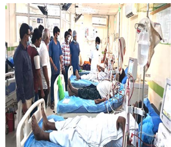
(షణ్ముఖ వెలుగు, కనిగిరి, జూన్ 17)

ఎలక్షన్ కోడ్ తో ఆగిపోయిన దయాలసిస్ ఫింఛన్లు ఇక్కట్లకు గురౌతున్న దయాలసిస్ రోగులు