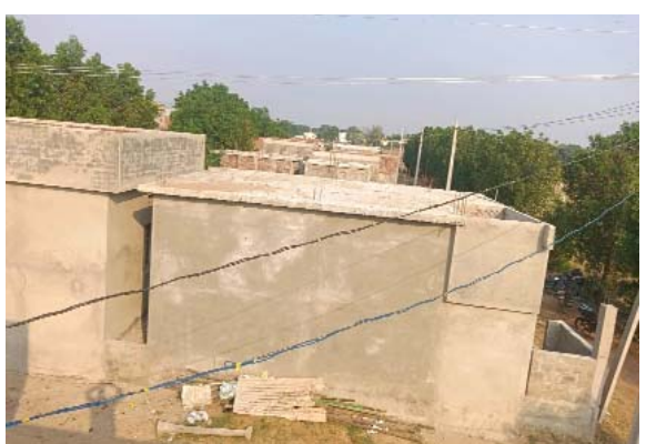
(షణ్ముఖ వెలుగు, జరుగుపల్లి, జూన్ 17)

అలంకార ప్రాయంగా ఓవర్ హెడ్ ట్యాంక్ ? మౌలిక వసతుల కల్పించకుండా పేదల గృహ నిర్మాణ సముదాయాలు ఎందు కోసం ?