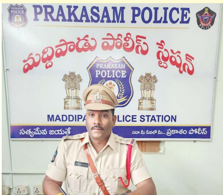
(షణ్ముఖ వెలుగు, మద్దిపాడు, జూన్ 1)