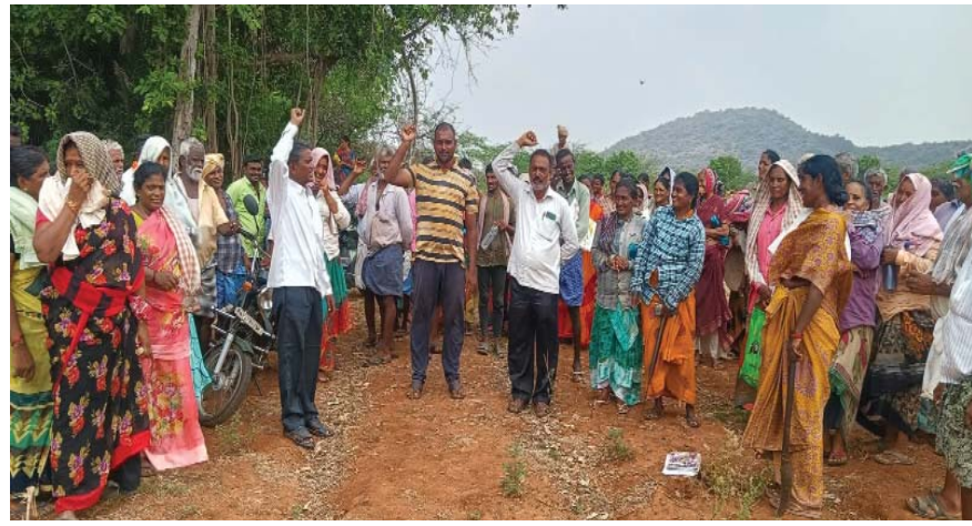
(షణ్ముఖ వెలుగు, టంగుటూరు, జూన్ 1)