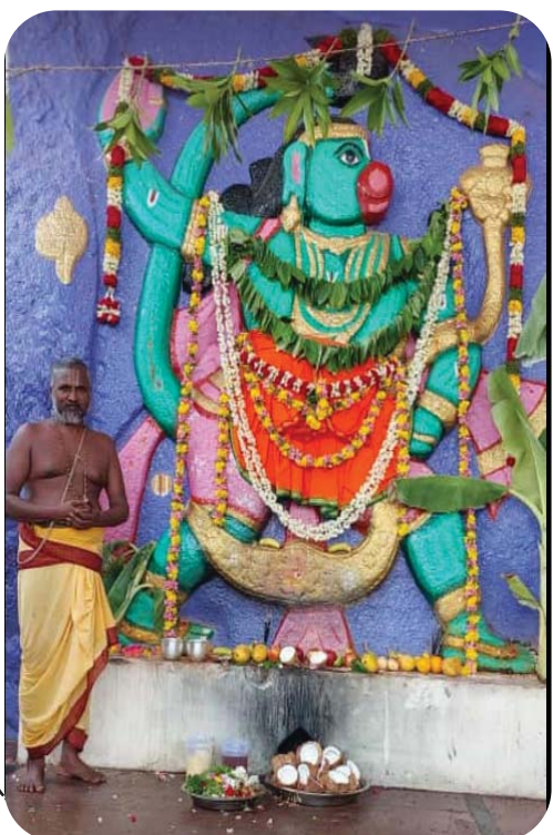
(షణ్ముఖ వెలుగు, నెల్లూరు, జూన్ 1)